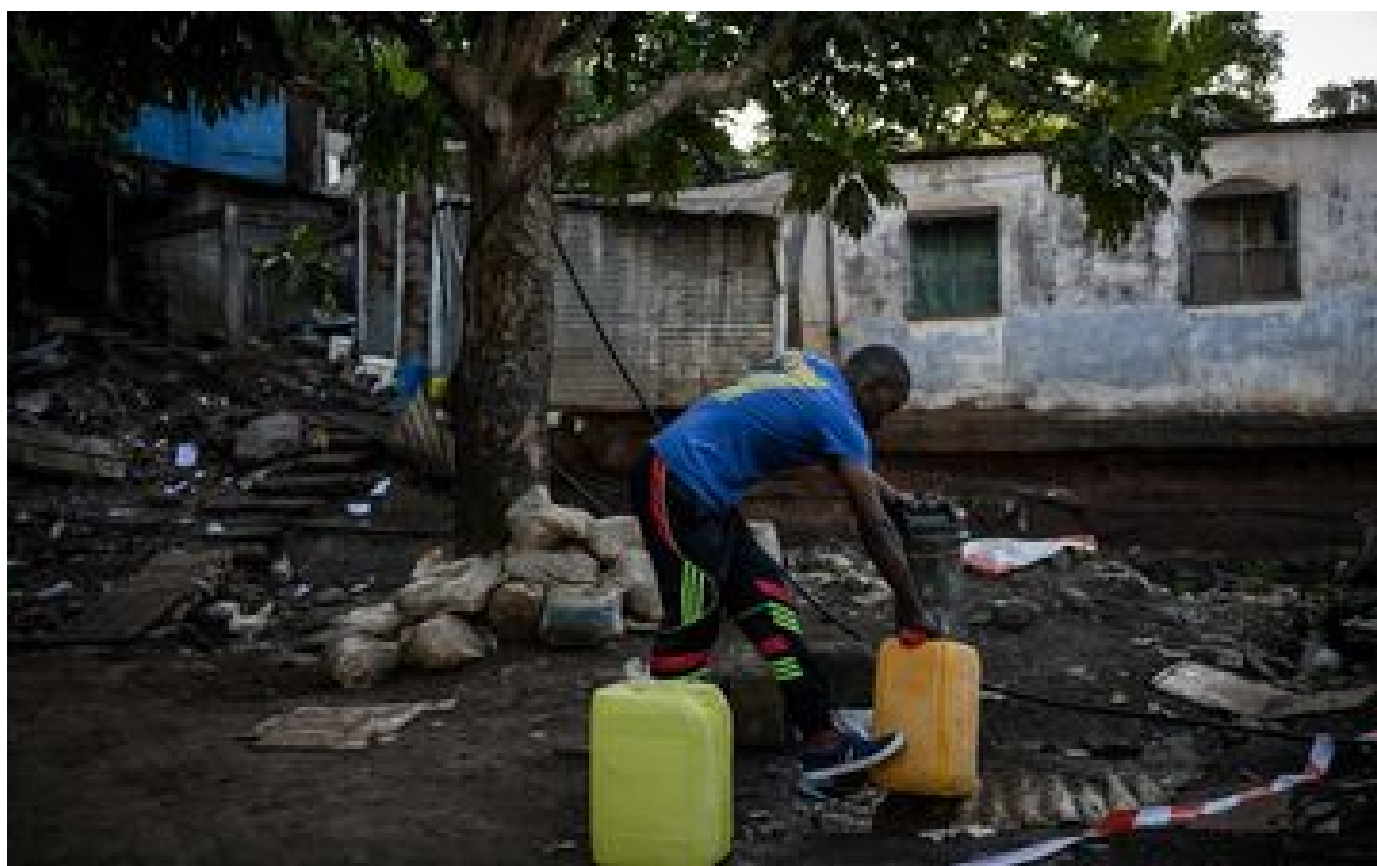
Sécheresse : 600 000 litres d'eau en bouteille distribués à Mayotte pour venir en aide à près de 50 000 personnes