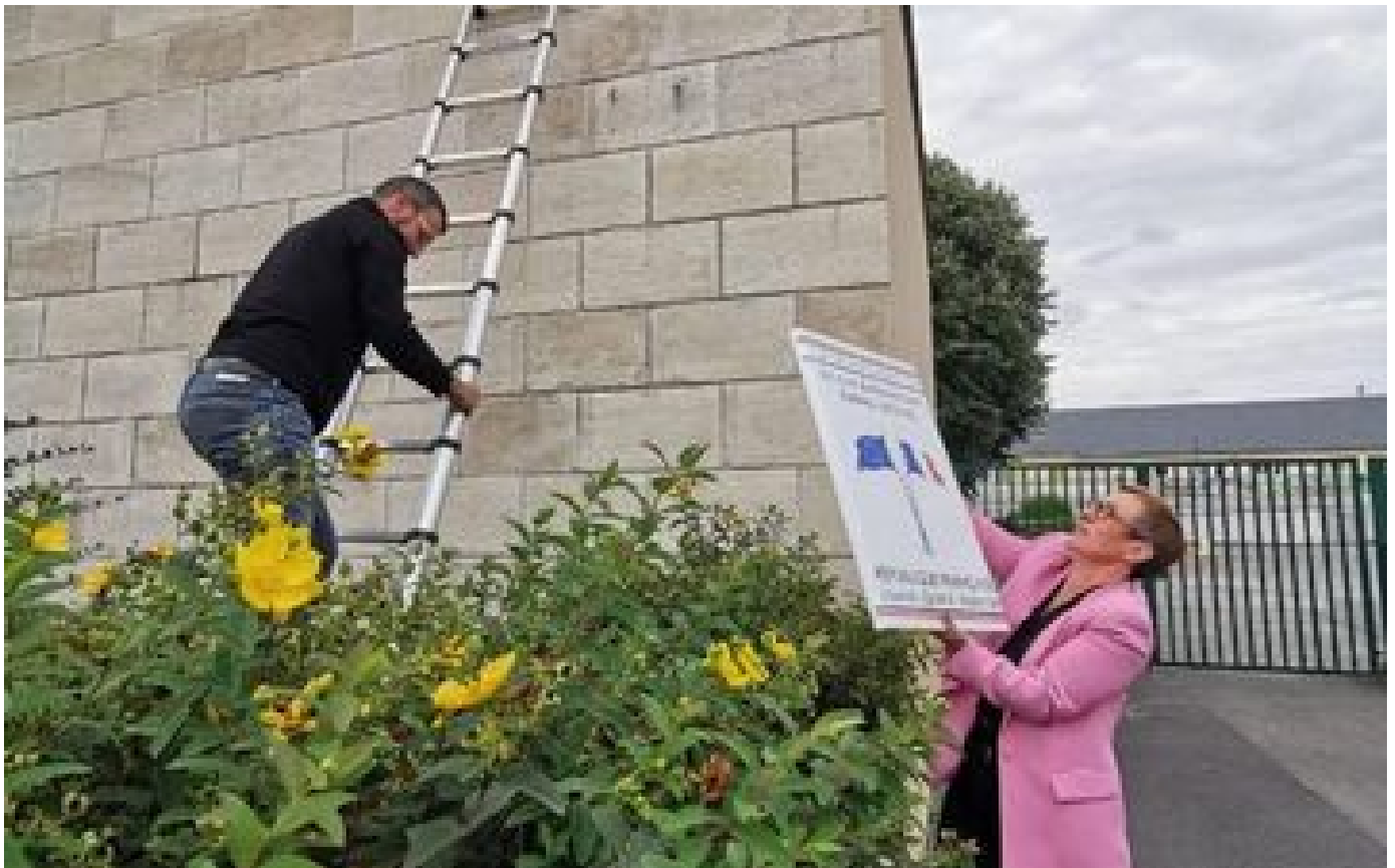
Dans le Calvados, l'école ne portera finalement pas le nom de son ex-maître accusé de violences