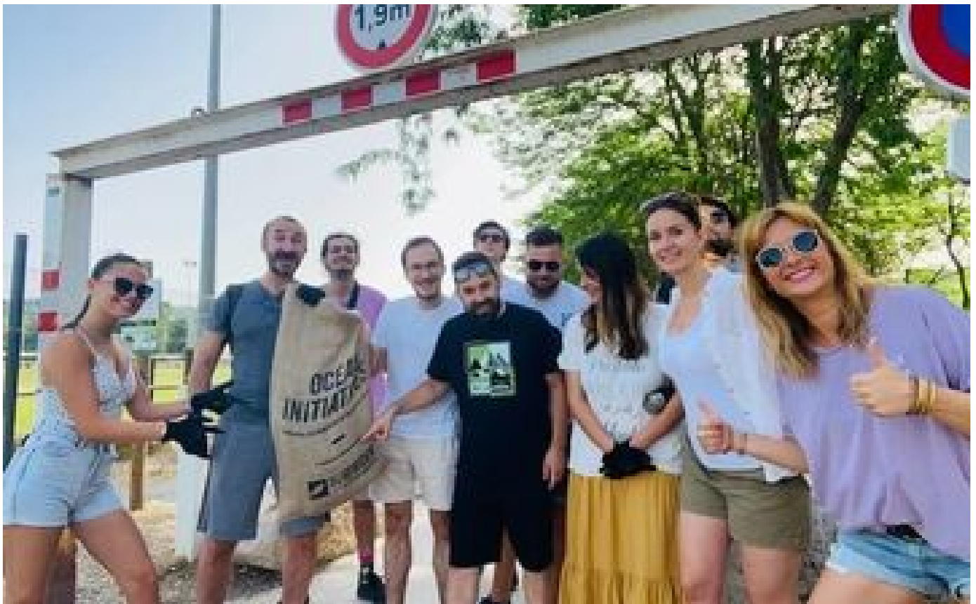
Vie pro-vie perso : une cinquième journée de travail pour faire autre chose