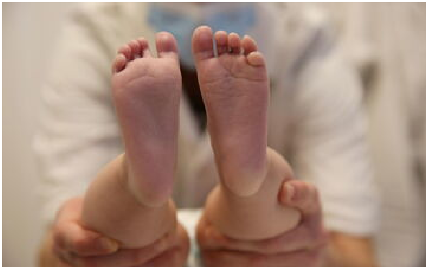
Bronchiolite : les passages aux urgences et les consultations à un niveau faible, mais en hausse