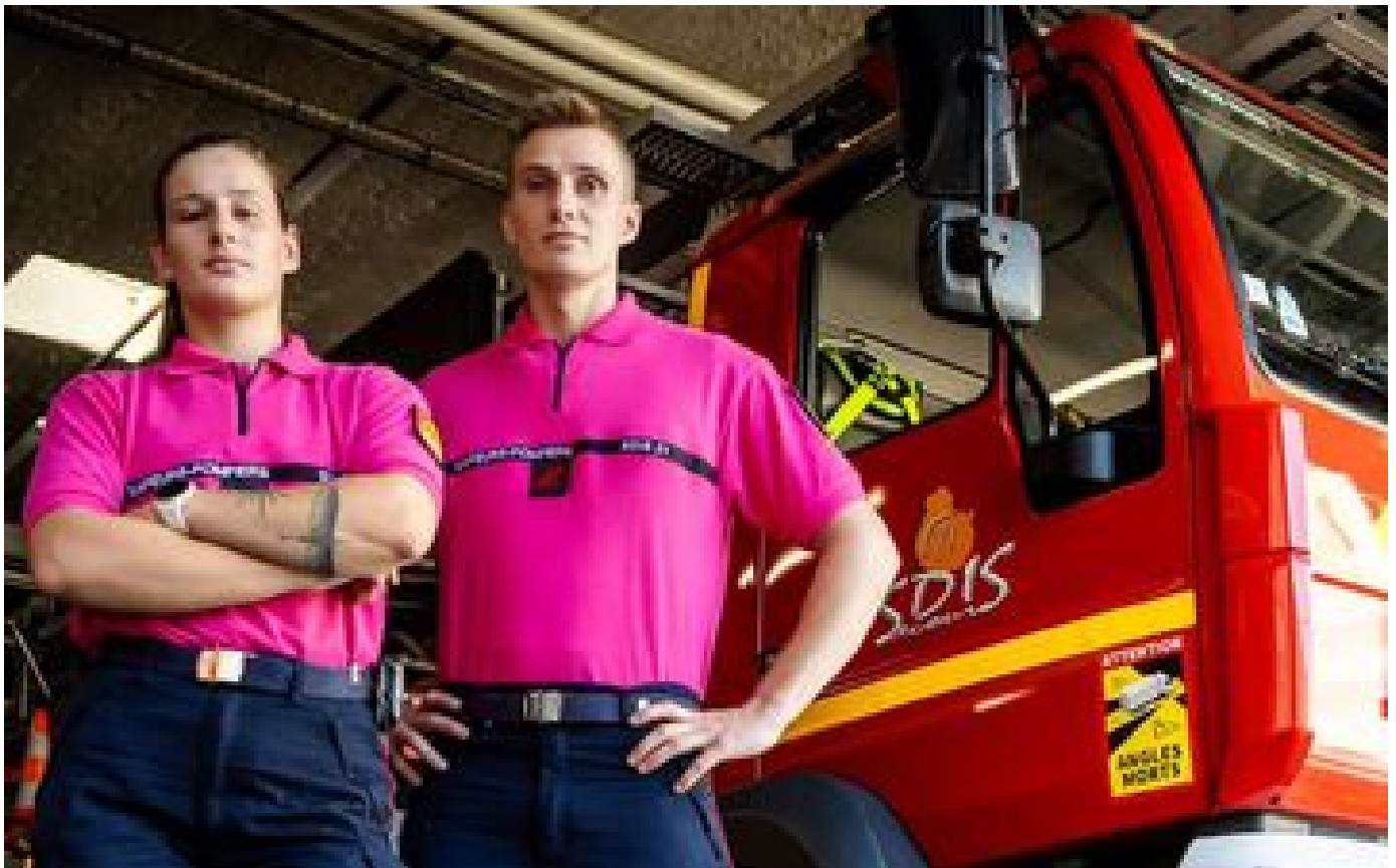
Octobre rose : les pompiers de Côte-d'Or seront vêtus de rose pour lutter contre le cancer