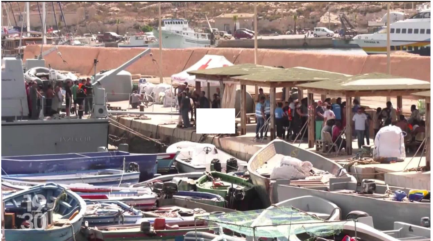
Le gouvernement italien adopte des mesures pour faire face à la vague d'arrivées de migrants sur l'île de Lampedusa / 19h30 / 1 min. / aujourd'hui à 19:30

Le gouvernement italien a approuvé lundi de nouvelles mesures pour endiguer les arrivées de migrants. Il entend notamment créer plus de centres de rétention et augmenter la durée de détention pour les migrants illégaux pour dissuader les départs d'Afrique du Nord.