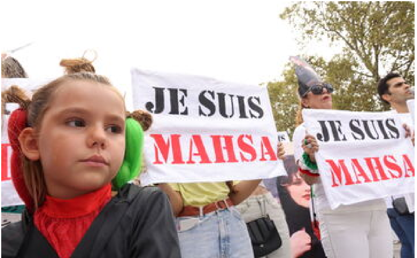
Mahsa Amini : les images de la marche en soutien aux Iraniennes à Paris