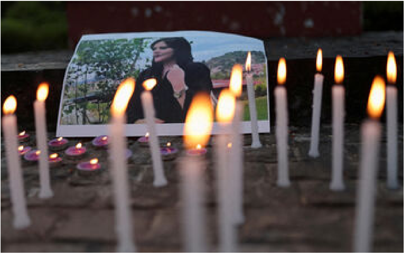
A Paris, un jardin rebaptisé en mémoire de l'Iranienne Mahsa Amini