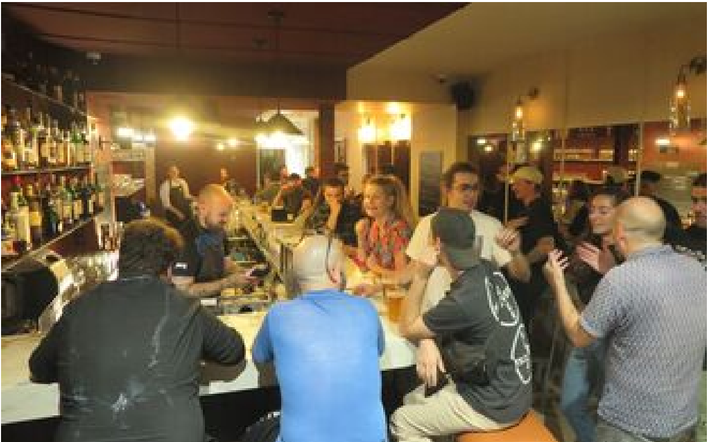
Une carte de qualité après 2 heures : et si Paris retrouvait des restaurants ouverts jusqu'au petit matin ? P