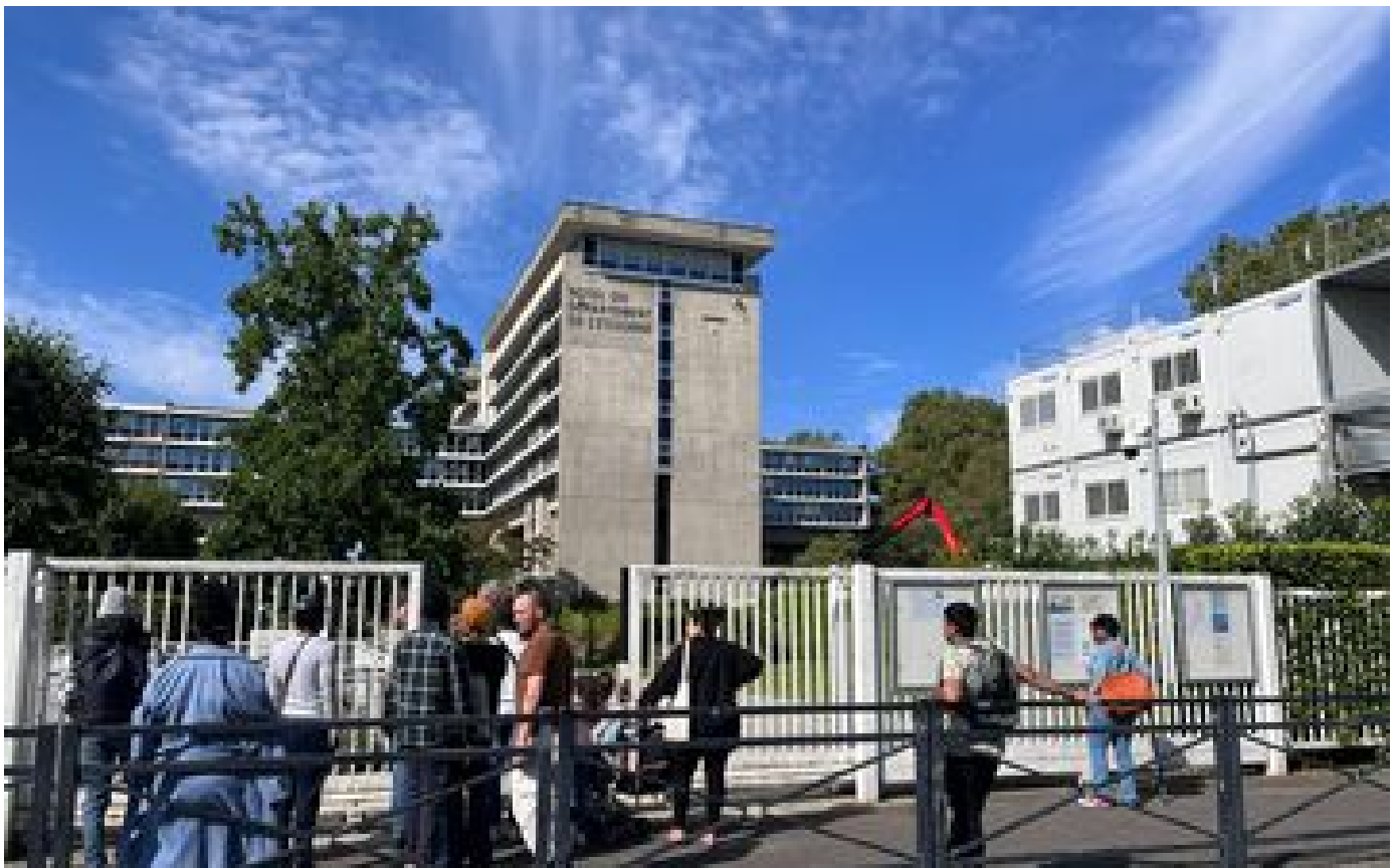
Les services de la préfecture de l'Essonne restent à l'arrêt après un nouvel incident électrique P