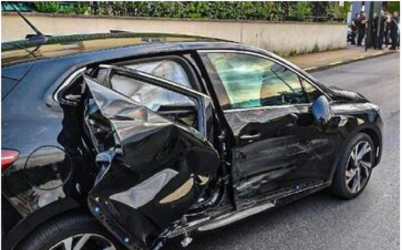
Un automobiliste percute un fourgon de police après une course-poursuite à Corbeil-Essonnes