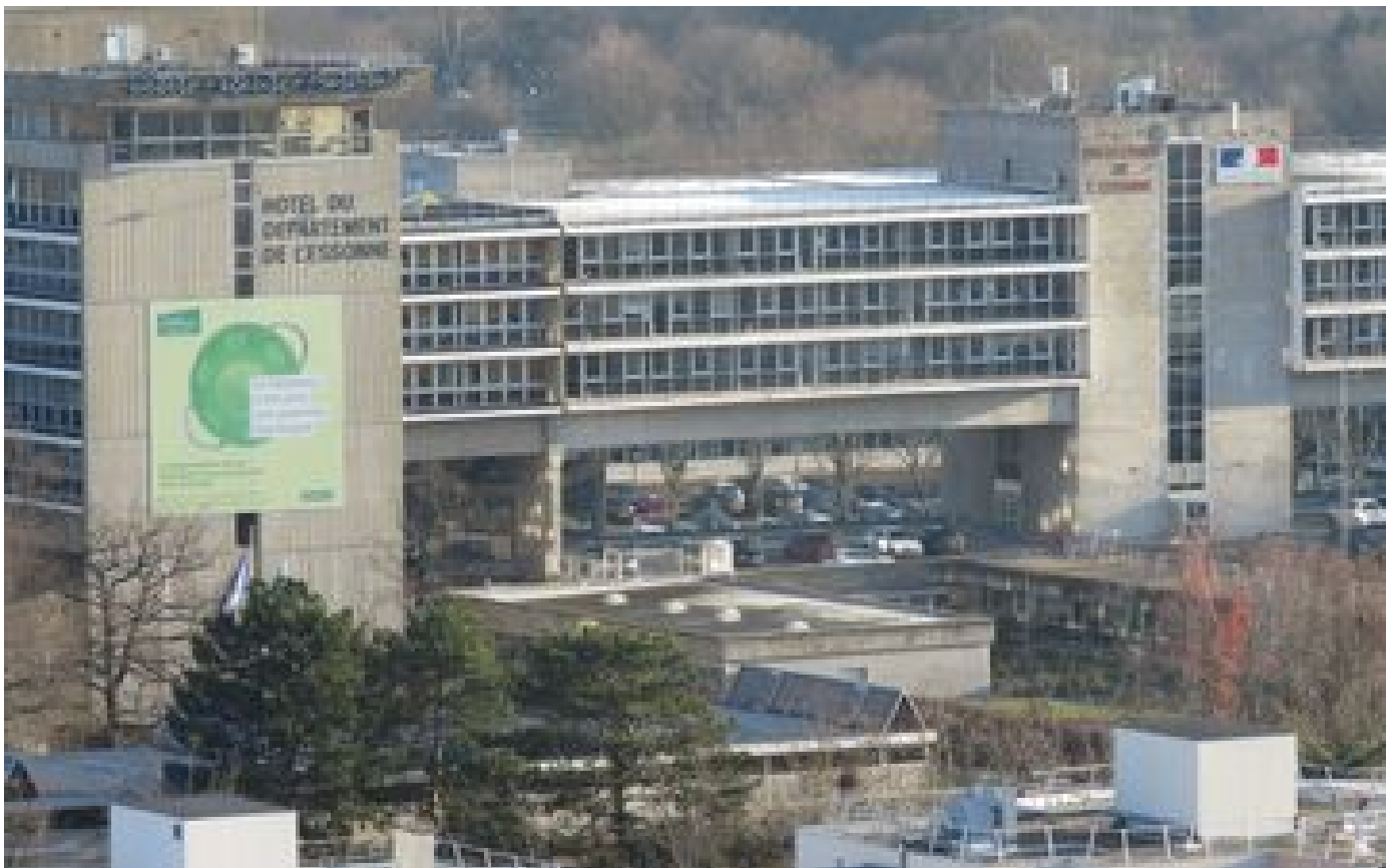
Coupure d'électricité : la préfecture de l'Essonne rouvre ses services au public « de manière dégradée »