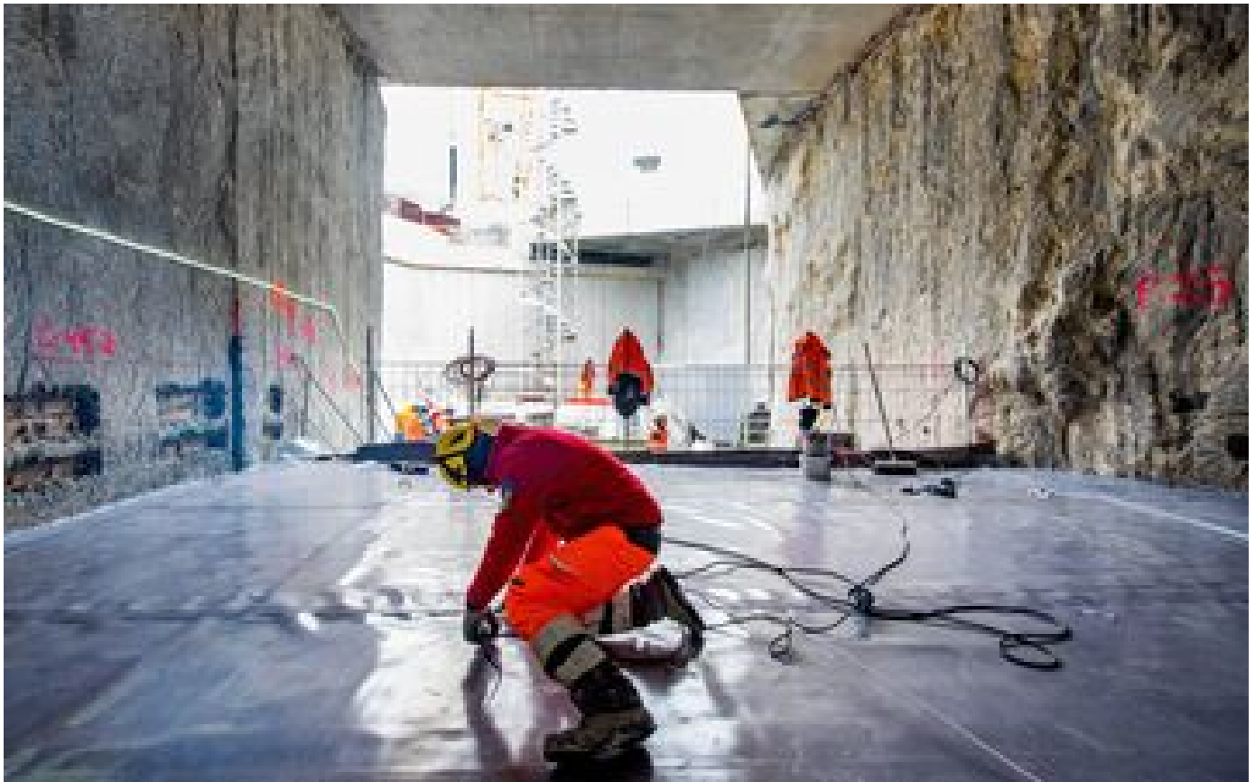
Île-de-France : la construction du Grand Paris Express dope l'emploi P