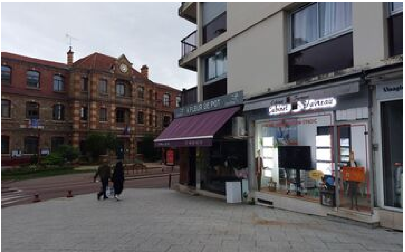
Publicités, enseignes lumineuses : extinction des feux dès 22 heures dans ces villes du Val-de-Marne et de l'Essonne P