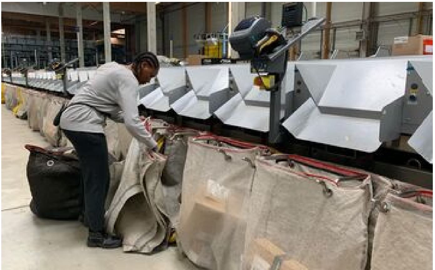
« On va passer à 44 000 colis par heure » : en Essonne, le centre de tri géant d'UPS accélère