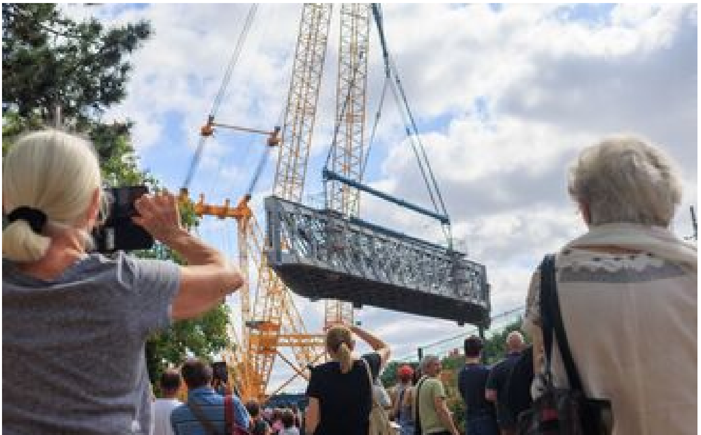
Remplacement des ponts de Chartres et Gallardon à Massy : les nouveaux ouvrages seront posés cette semaine