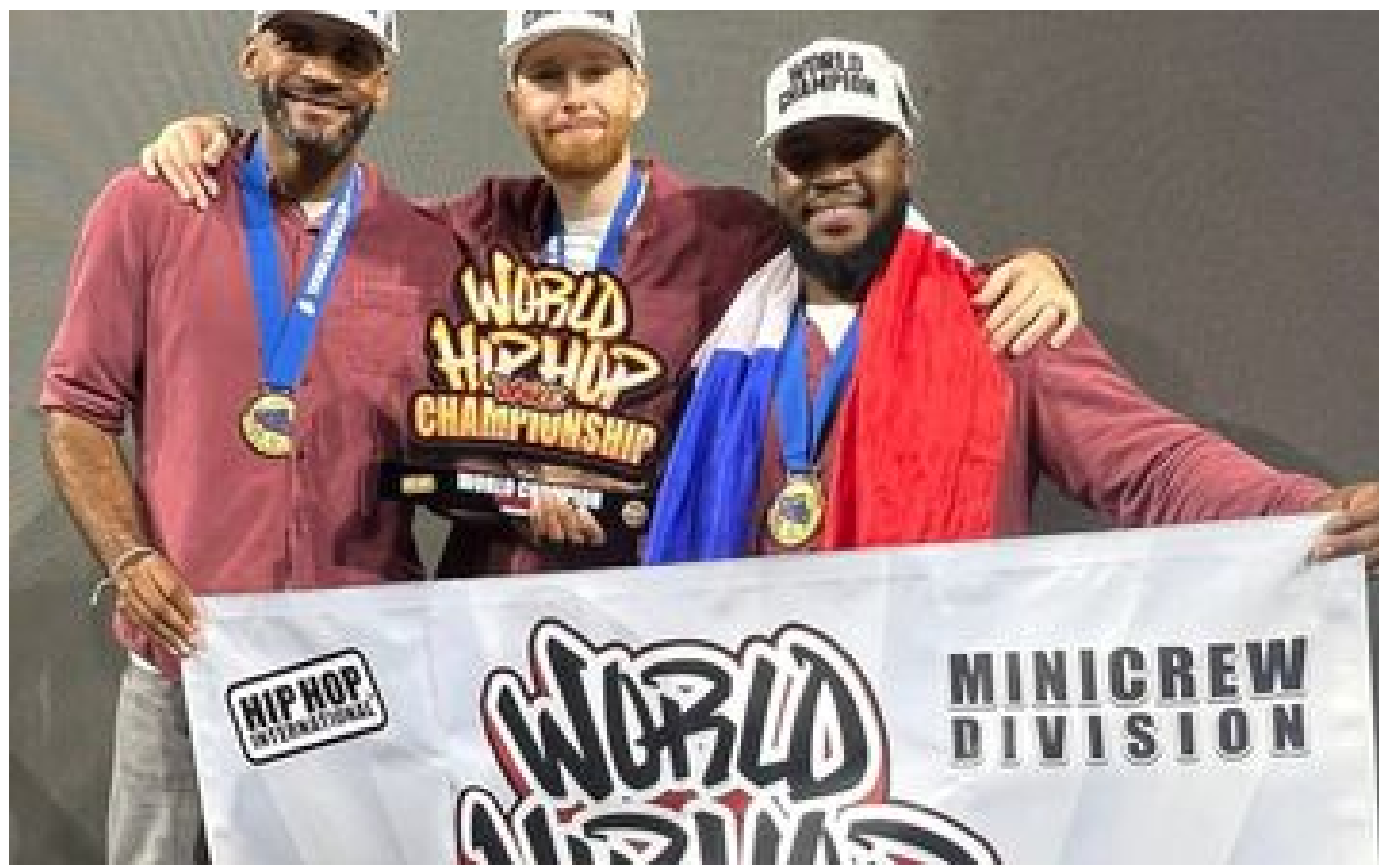
« Un rêve » : les danseurs de l'Essonne et du Val-de-Marne décrochent l'or aux championnats du monde de hip-hop