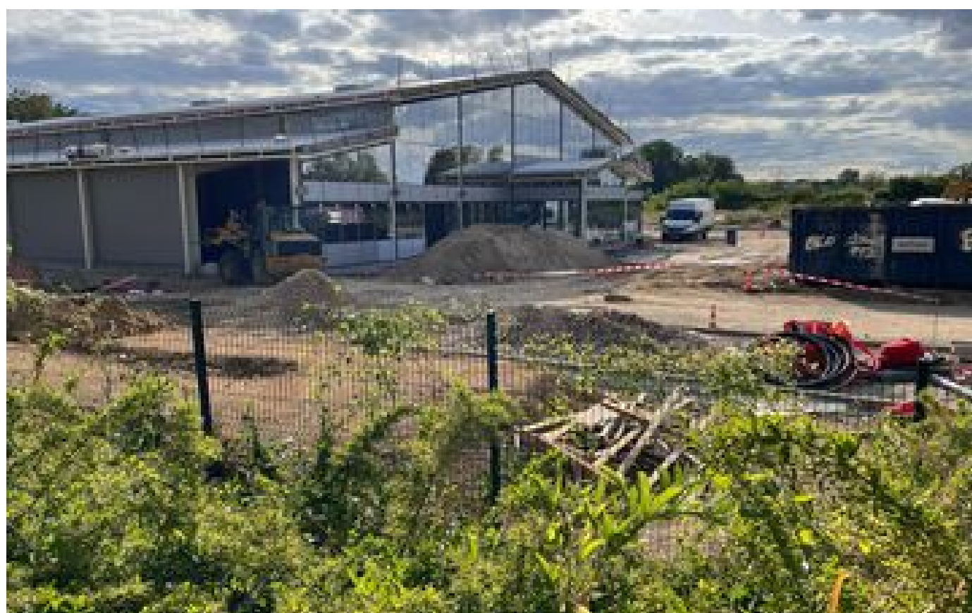
Évry-Courcouronnes : malgré les recours, la construction du magasin Grand Frais a commencé