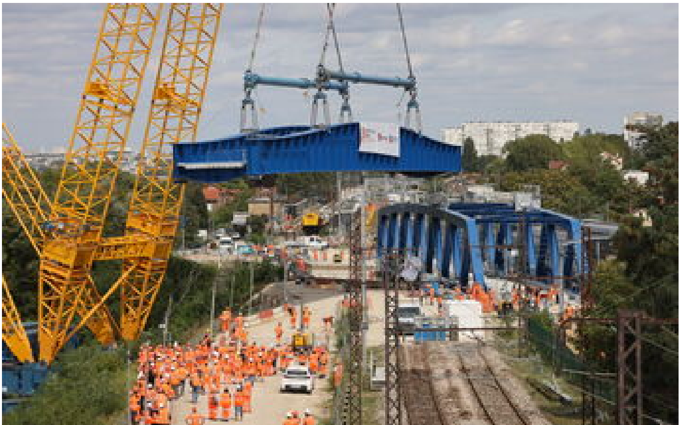
À Massy, la grue géante a posé sans accroc les nouveaux ponts des RER B et C P