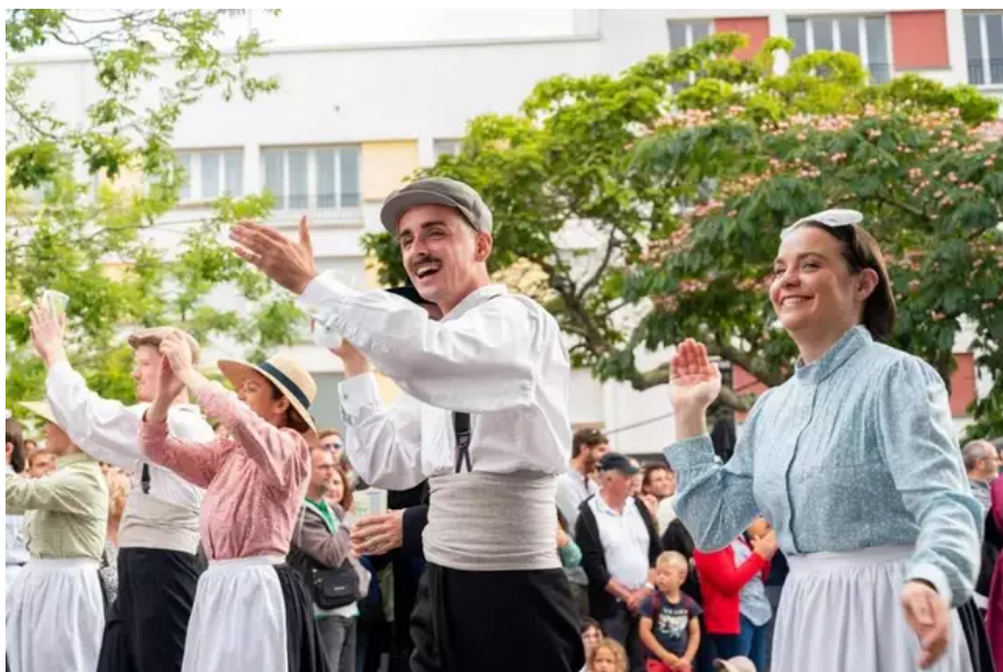
Lors du traditionnel Triomphe des sonneurs dans les rues de Lorient où les danseurs de cercles sont aussi de la fête.