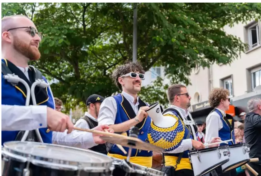
Les sonneurs ont joué le même air, le « Sant-Patrick Andro ».

Et pour le public, massé de part et d'autre du défilé qui sonne comme la seconde parade de la journée.