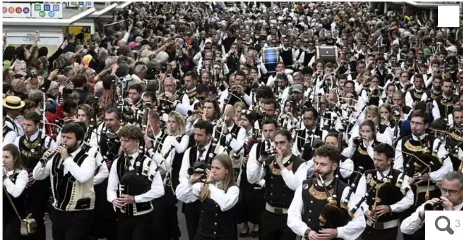
Le Triomphe a des allures de marée de sonneurs. Elle déferle, chaque année, en centre-ville à la fin du premier week-end du Festival Interceltique de Lorient.

Du Kleub à la place Alsace-Lorraine, la marche triomphale des sonneurs, toutes catégories confondues, a fait son effet dimanche 6 août 2023, en ville. Il sonne la fin d'un premier week-end intense à Lorient (Morbihan).