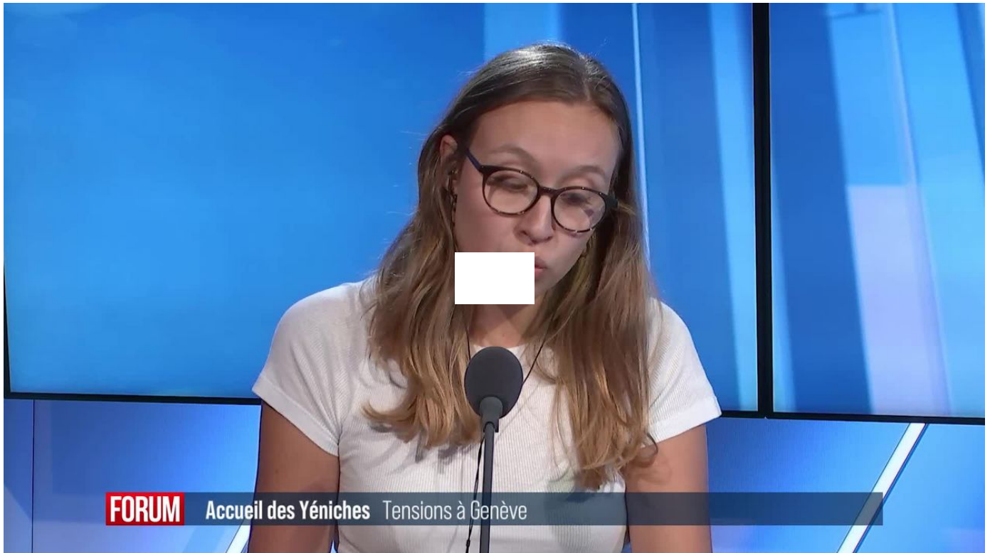
Des Yéniches occupent sans autorisation un terrain à Thônex (GE) / Forum / 2 min. / hier à 18:00

Des Yéniches occupent depuis dimanche un terrain de la commune genevoise de Thônex. Ils critiquent l'absence de place accordée à leur communauté, en particulier dans le canton de Genève. Un accord a été trouvé lundi après-midi, mais une plainte pénale reste en suspens.