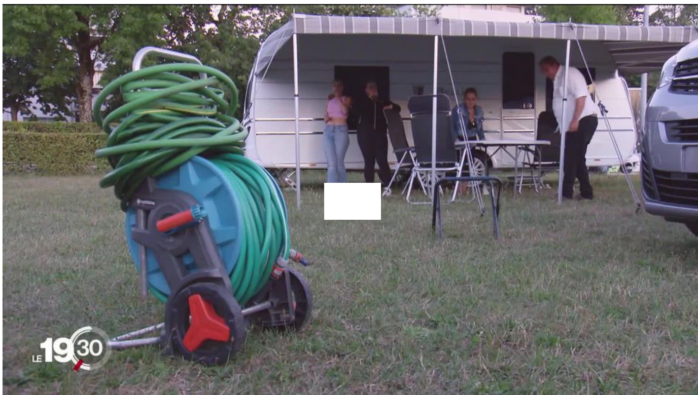
Des Yéniches se sont installés à Genève / 19h30 / 2 min. / hier à 19:30