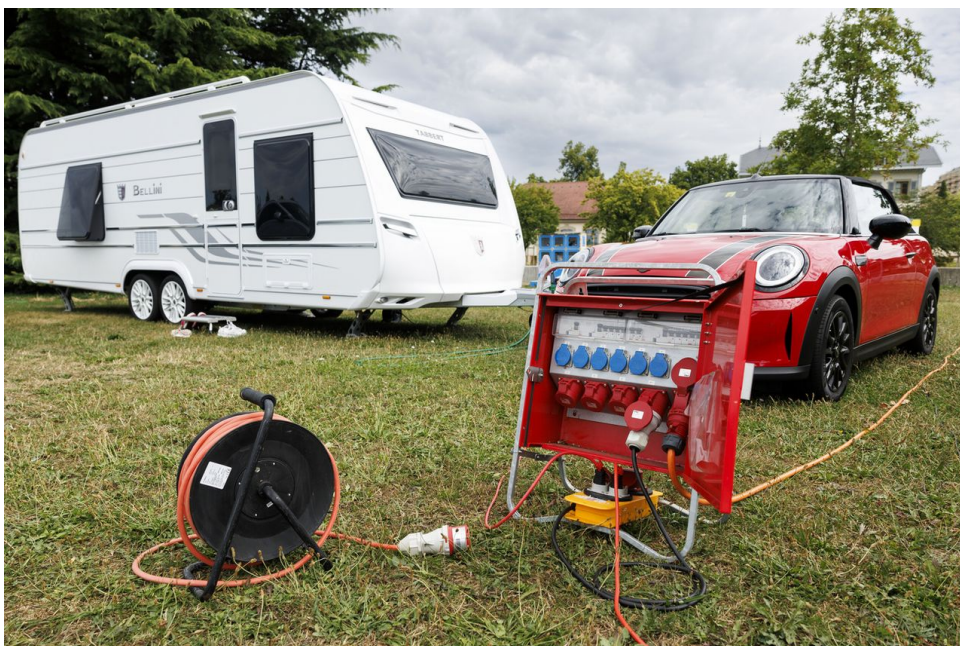
Le campement de Yéniches installé dans le parc François-Auguste-Châtrier, dans la commune genevoise de Thônex.

Ils laissent aussi les emplacements propres, souligne-t-il. A Thônex, ils ont installé une benne pour leurs déchets et des toilettes.