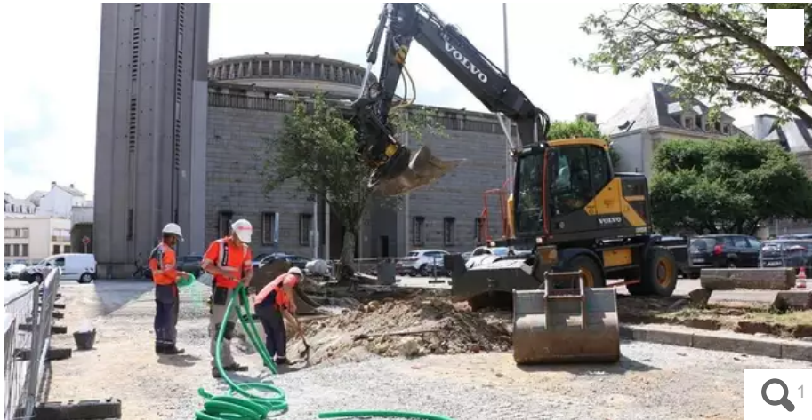
Les aménagements du premier parking payant sont en cours place Alsace-Lorraine en vue d'une mise en service début novembre.

Le déploiement du stationnement de surface payant se concrétise place Alsace-Lorraine, à Lorient (Morbihan). Les tarifs horaires sont désormais connus pour trois des six nouveaux parkings.