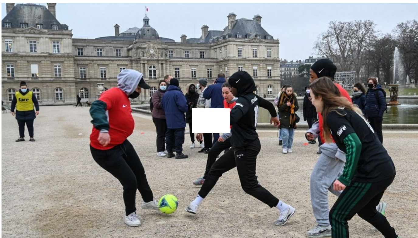
L'interdiction du hijab dans le football français est maintenue par le Conseil d'Etat / Le Journal horaire / 16 sec. / hier à 20:02

Le Conseil d'Etat a rejeté jeudi la requête de "Hijabeuses" qui voulaient jouer au foot voilées, une affaire qui a provoqué une levée de boucliers de la classe politique et d'appels à légiférer sur la question des signes religieux dans le sport.