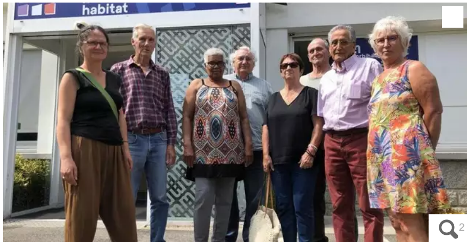
Des habitants d'un immeuble de Kervénanec, à Lorient (Morbihan), sont venus dire son mécontentement à Morbihan Habitat, après que leur ascenseur est tombé en panne il y a plus d'un mois et demi.

Depuis le 13 mai 2023, les habitants d'un immeuble de sept étages du quartier de Kervénanec, à Lorient (Morbihan), sont privés d'ascenseur. Une panne qui leur cause bien des désagréments. Excédés, ils sont venus rencontrer au débotté des responsables de Morbihan Habitat.