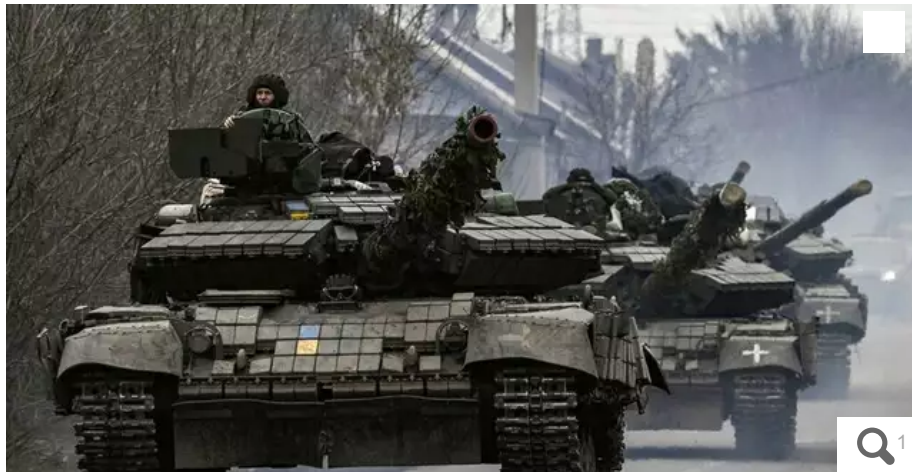
Plusieurs organisations politiques organisent un rassemblement, mardi 27 juin 2023, à 18 h, devant la sous-préfecture de Lorient pour réclamer le cessez-le-feu en Ukraine et contre la Loi de programmation militaire.

Plusieurs organisations politiques organisent un rassemblement mardi 27 juin 2023, à 18 h, devant la sous-préfecture de Lorient (Morbihan) pour réclamer le cessez-le-feu en Ukraine.