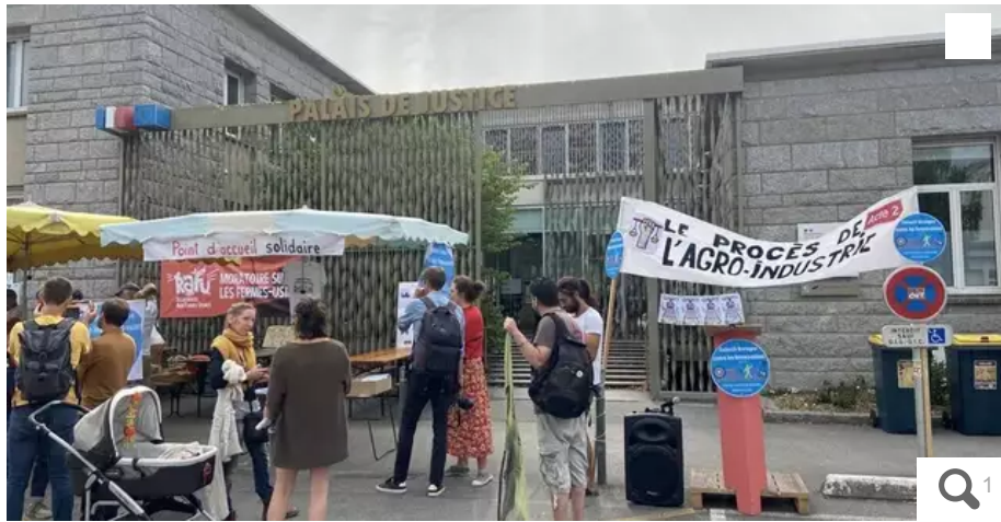
Le collectif "Bretagne contre les fermes-usines" est présent depuis ce mardi 27 juin au matin devant le tribunal de Lorient.

Ce mardi 27 juin, le collectif « Bretagne contre les fermes-usines » s'est rassemblé devant le tribunal de Lorient (Morbihan) pour soutenir plusieurs de ses militants. Ils sont mis en examen après l'action du collectif pour stopper un train de marchandise, en mars 2022, à Saint-Gérand.