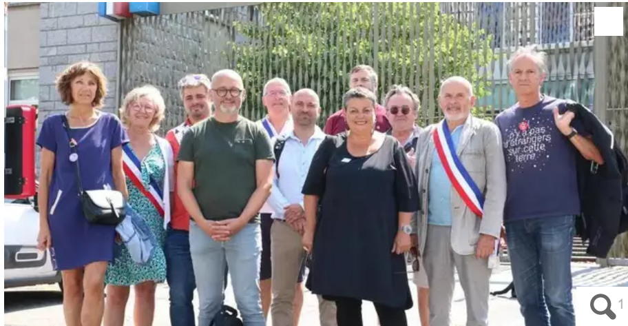
Les élus et syndicalistes du pays de Lorient à leur sortie du tribunal de Lorient jeudi matin.

Après la plainte collective déposée jeudi 22 juin 2023 au tribunal de Lorient (Morbihan) par des élus et syndicalistes visés par un site d'extrême droite, le procureur général de la Cour d'appel de Rennes rappelle qu'elle fera l'objet « d'investigations approfondies ».