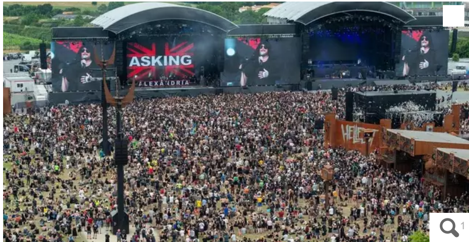
Le ?site du festival Hellfest, samedi 17 juin, lors du concert de Asking Alexandria sur la Mainstage.