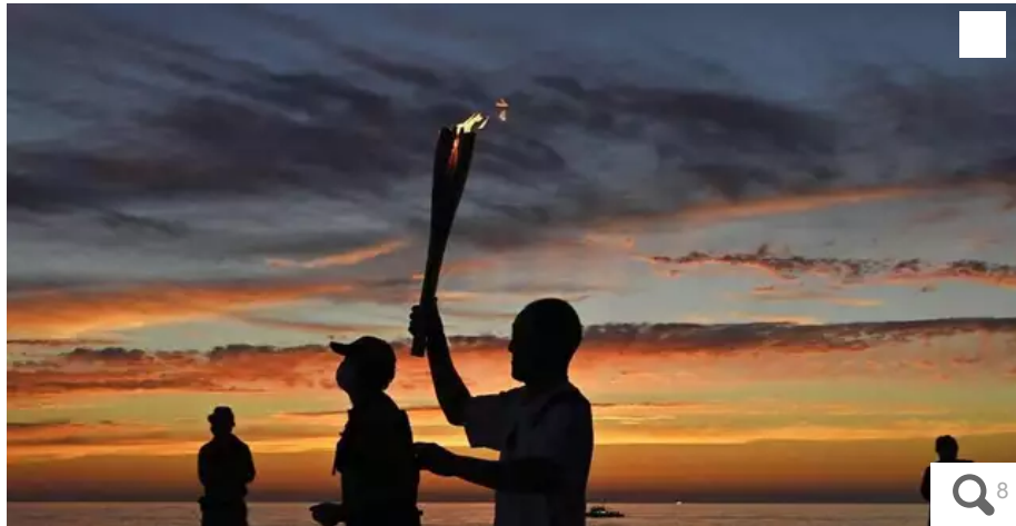
La flamme olympique visitera sept lieux emblématiques du Morbihan. /Photo d'illustration. © Kyodo/MAXPPP

Sept villes du Morbihan vont accueillir le passage de la flamme olympique pour les JO de 2024. Les heureuses élues, dont Vannes, Lorient, Pontivy, Josselin... s'apprêtent à vivre un grand événement. Leurs représentants témoignent de leur enthousiasme.