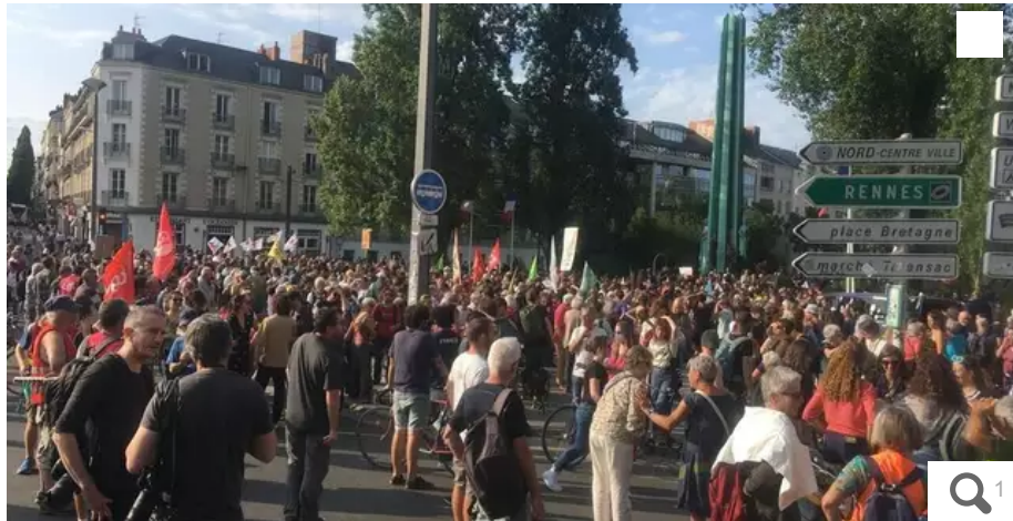
Une millier de personnes sont rassemblées devant la préfecture de Nantes, ce mercredi 21 juin, en soutien au collectif des Soulèvements de la Terre.

La dissolution a été enclenchée pour le mouvement des Soulèvements de la Terre ce mercredi 21 juin, en Conseil des ministres. Le collectif écologiste a appelé à un rassemblement de soutien devant les préfectures de France. À Nantes, le rendez-vous était donné à 18 h, quai Ceineray.