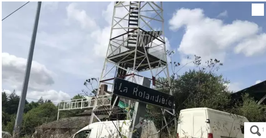
La Rolandière, haut lieu de la contestation antilibérale, à Notre-Dame-des-Landes, en Loire-Atlantique.

Six zadistes ont été interpellés mardi 20 juin à l'aube, à Notre-Dame-des-Landes, en Loire-Atlantique. Tout un symbole. C'est ici qu'ont été semées les graines des Soulèvements de la Terre.