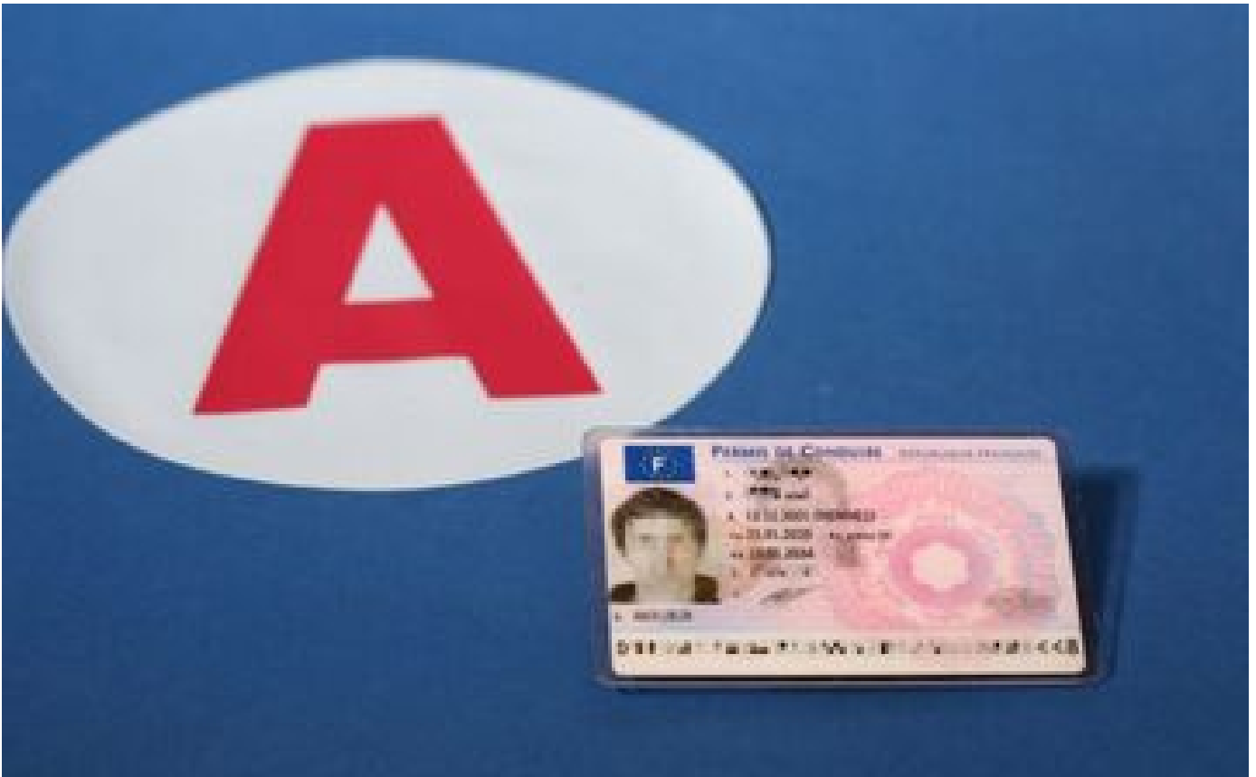
Permis de conduire à 17 ou 16 ans : ce que ça pourrait changer pour les jeunes