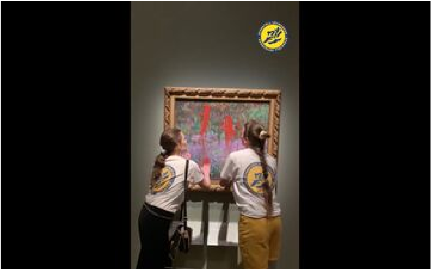
Suède : des militantes écologistes badigeonnent de peinture un tableau de Monet