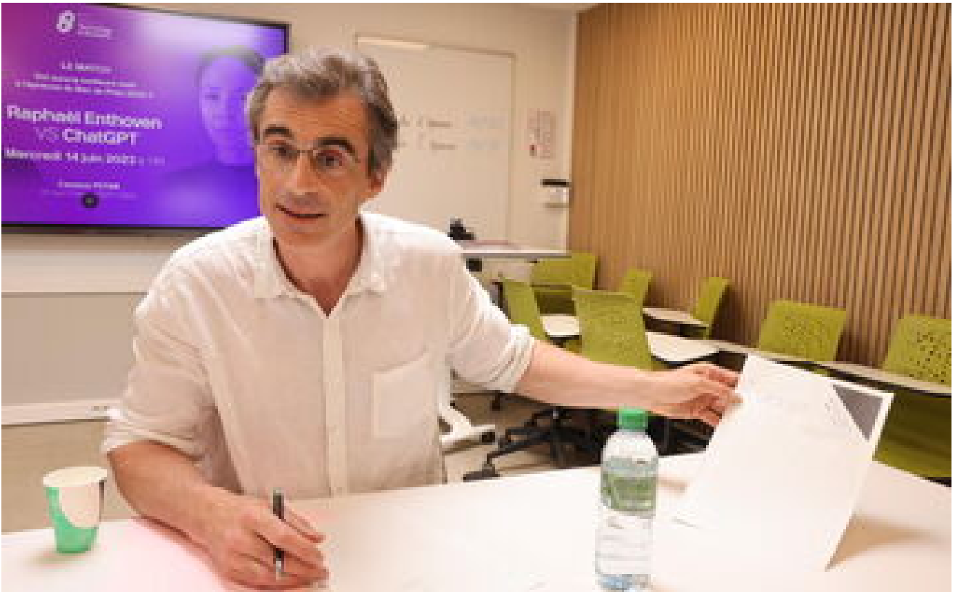
Bac philo : Raphaël Enthoven sort grand vainqueur de son duel contre ChatGPT P