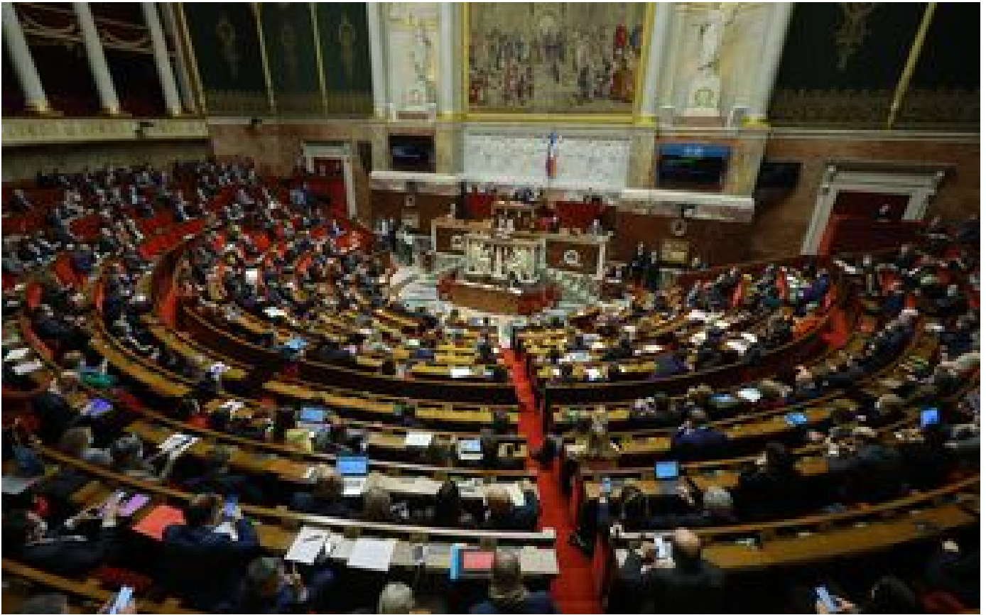
Déserts médicaux : les députés rejettent une mesure de restriction de la liberté d'installation