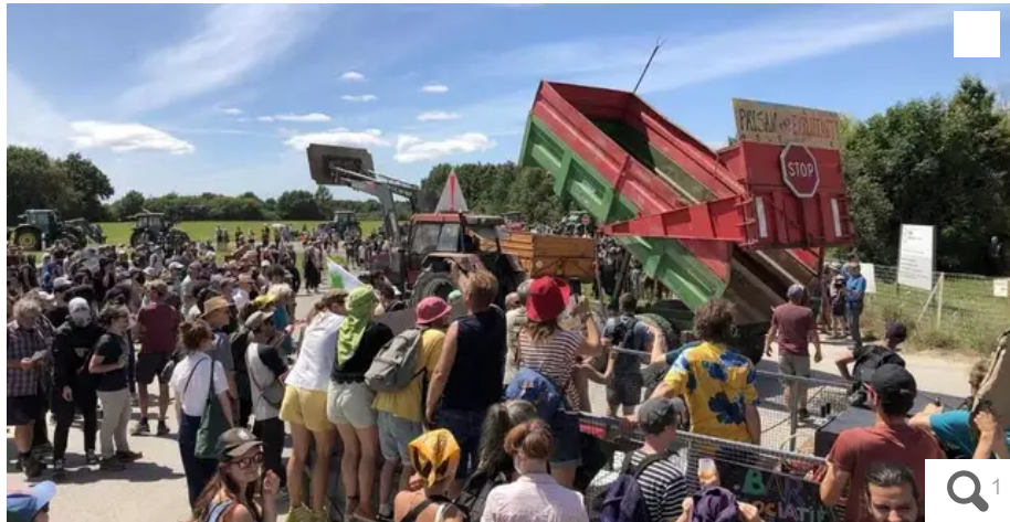
L'été dernier, 700 manifestants avaient rejoint Saint-Colomban contre le projet d'extension des sablières.