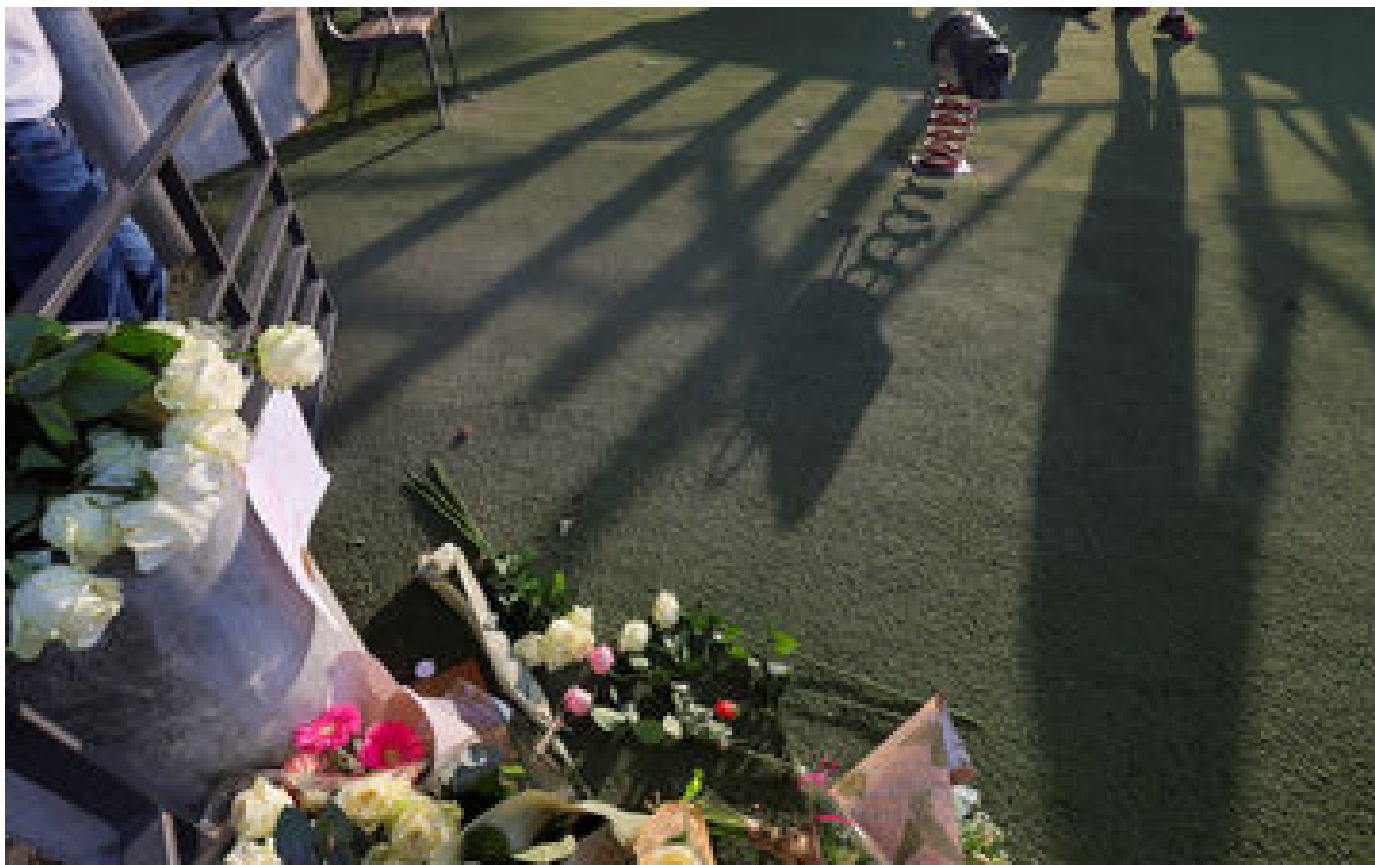
Attaque au couteau d'Annecy : le récit des longues minutes de terreur sur l'aire de jeux P