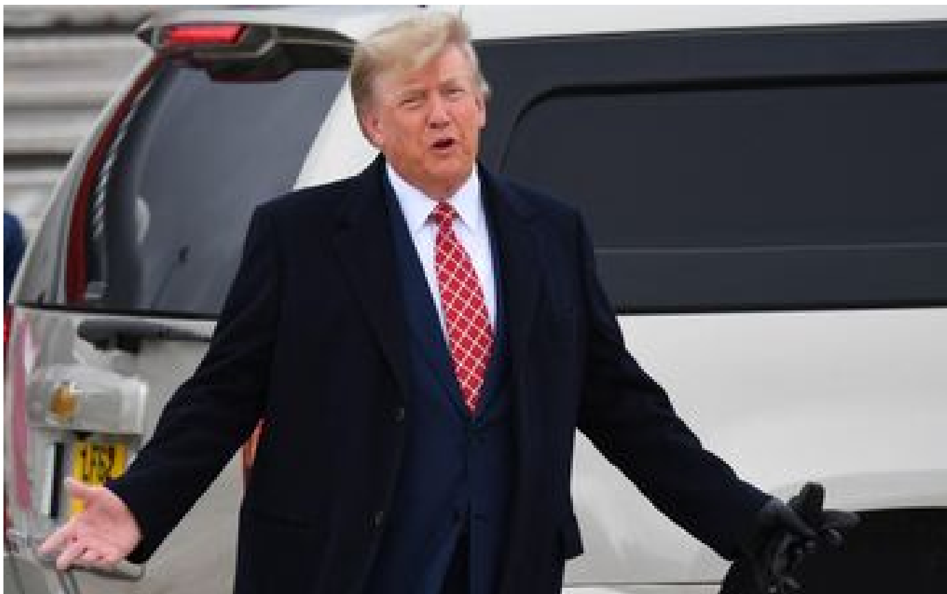
Condamné pour « agression sexuelle », Donald Trumpet réclame un nouveau procès