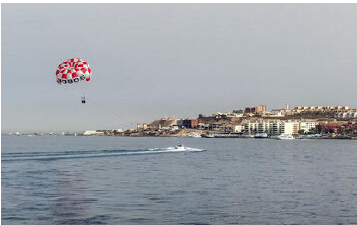
Égypte : attaque mortelle d'un requin près de la station balnéaire d'Hurghada