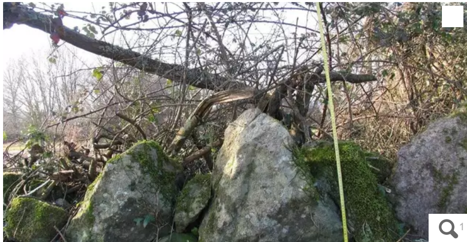
Une partie des monolithes du site de Montauban, à Carnac, avant sa destruction.

En moins de 24 heures, la destruction d'un site regroupant des menhirs et petits monolithes a reçu un écho médiatique et politique hors du commun. Une affaire chargée de symboles, qui ont fini par évacuer totalement sa complexité.