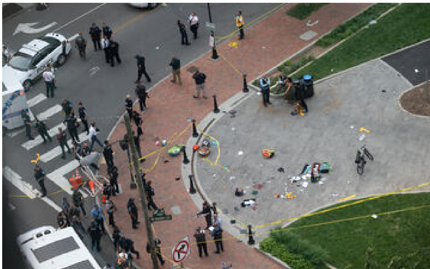
États-Unis : la fusillade à la remise de diplômes fait deux morts et cinq blessés