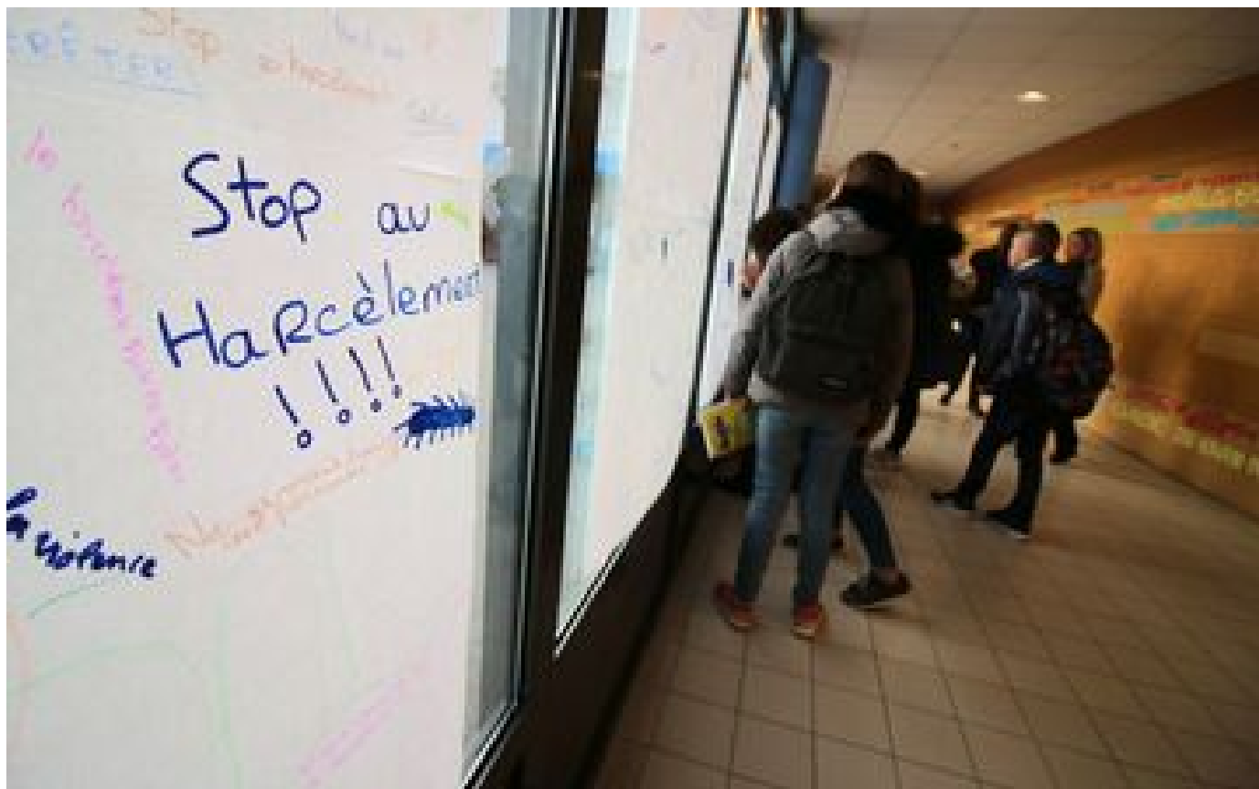
Suicide de Lindsay : le rectorat porte plainte après des menaces contre le personnel du collège