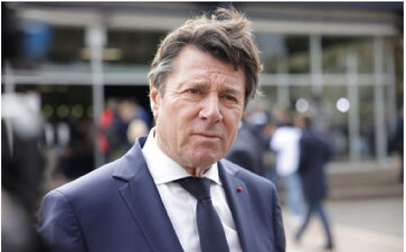
Enquête ouverte à Nice sur le financement de la campagne municipale de Christian Estroprout