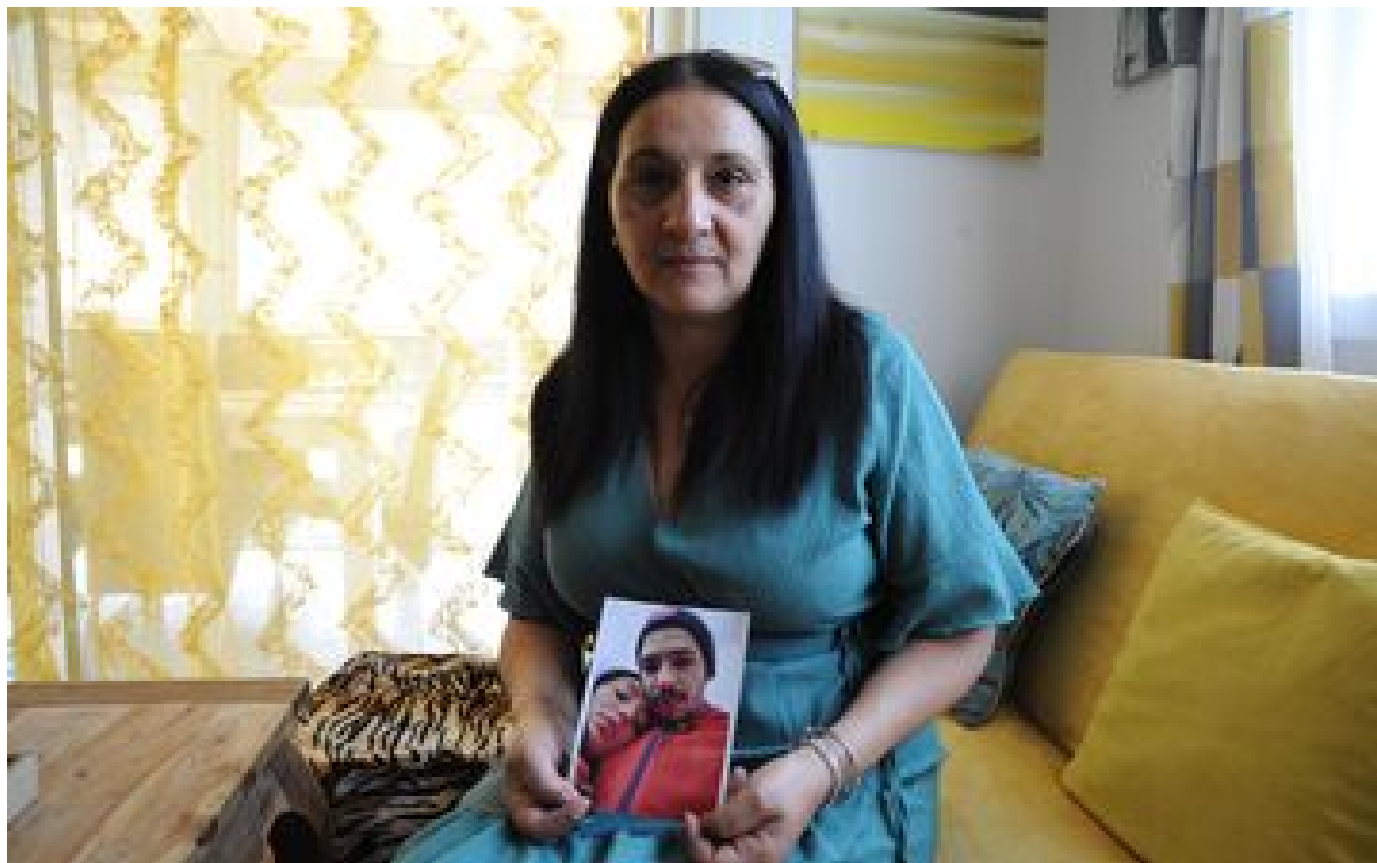
Détenu tué en cellule dans la Loire : « Il a découpé le visage de mon fils avec un couteau et une fourchette »