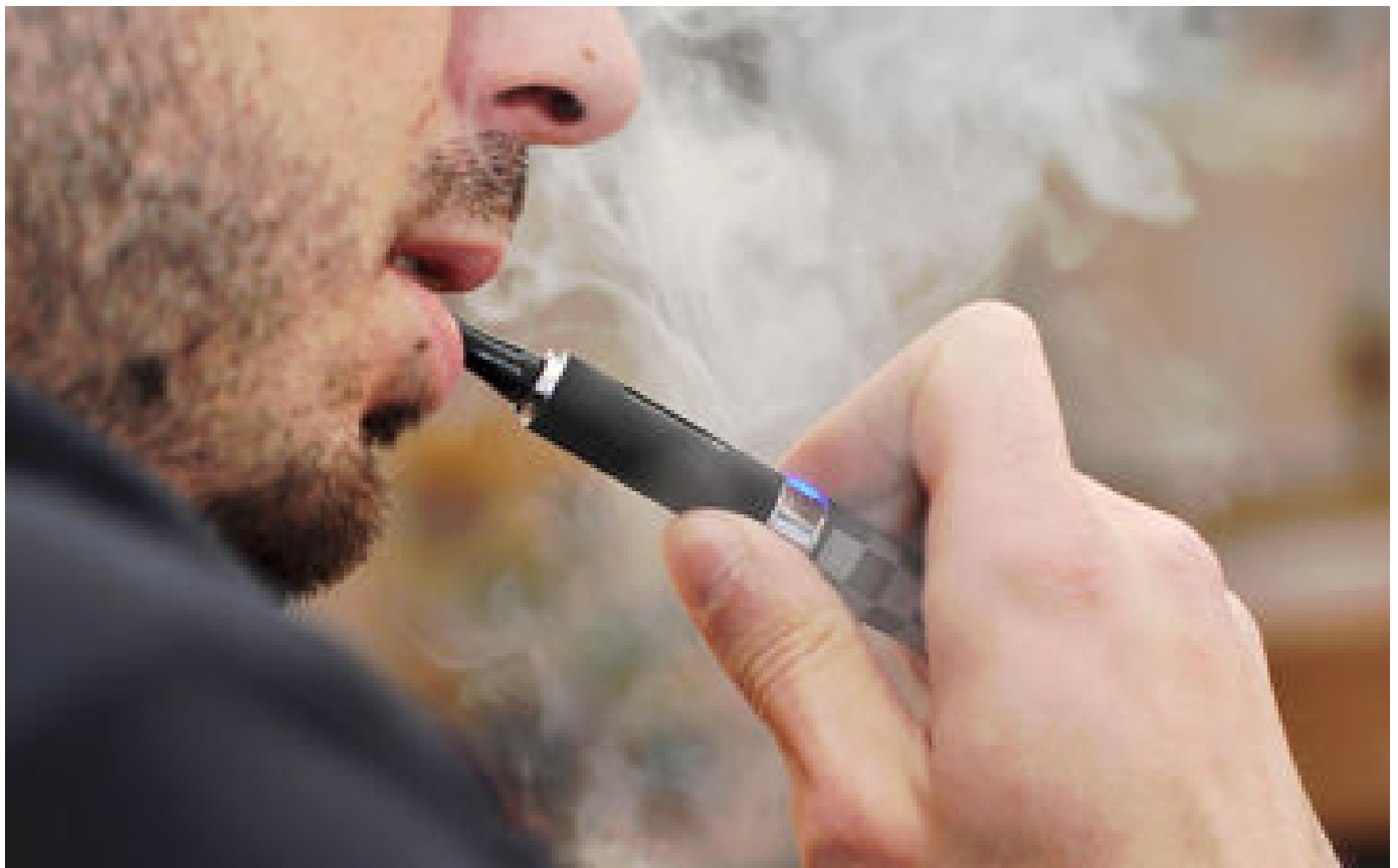
Arrêter de fumer avec une cigarette électronique sur ordonnance, une bonne idée ? P