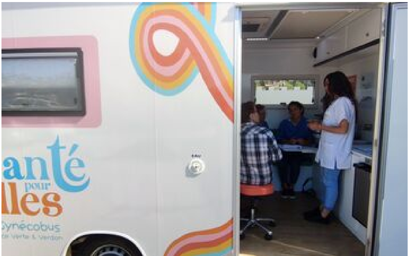
Le Gynécobus, cabinet médical ambulante, assailli de demandes P