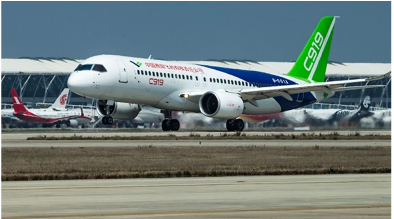
Le C919 de Comac est sur les rails

Une menace pour ce duopole qui se partage le colossal marché de l'aéronautique civil dans le monde? En dehors de la Chine et de quelques pays d'Afrique, le C919 n'est pas autorisé à voler ailleurs, l'appareil n'ayant pas été certifié par la FAA (Federal Aviation Administration) et l'EASA (European Aviation Safety Agency).