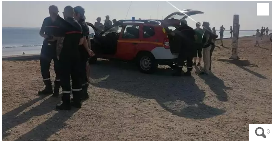
D'importants moyens enclenchés sur la plage du Linès.

Ce dimanche 28 mai, peu avant 18 h, sur la plage du Linès, à Plouhinec (Morbihan), le bateau gonflable d'enfants part à la mer. Trop loin, il ne peut être rattrapé. Une personne ayant cru voir quelqu'un à côté de l'embarcation a donné l'alerte. D'importants moyens ont été enclenchés. Mais fausse alerte.