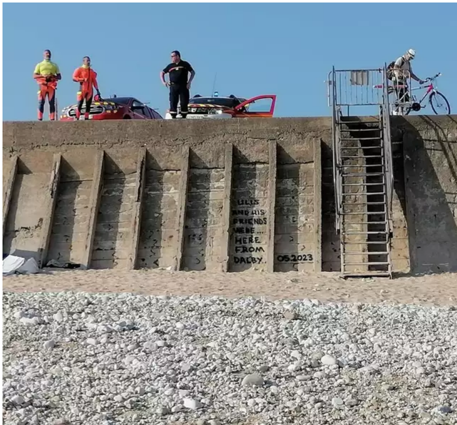
D'importants moyens enclenchés sur la plage du Linès.

Une personne plus loin sur la plage croit voir quelqu'un à côté de cette embarcation vide et lance l'alerte.