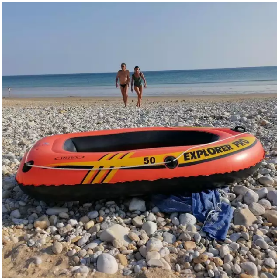
Le bateau a finalement été ramené à la famille.

Une personne plus loin sur la plage croit voir quelqu'un à côté de cette embarcation vide et lance l'alerte.