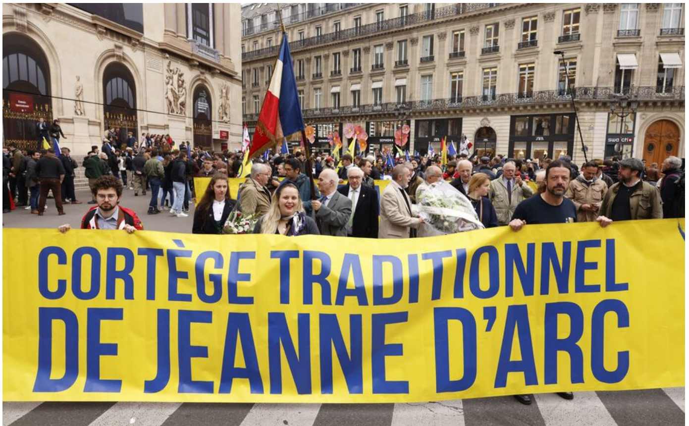
A la manifestation de l'Action Française pour célébrer Jeanne d'arc, ce dimanche 14 mai à Paris.

venue d'une la justice prononcée par la niveau défilé, ce