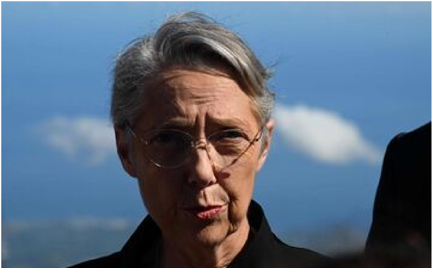
Réforme des retraites : Elisabeth Prout, qui va recevoir les syndicats, se dit « à l'écoute »