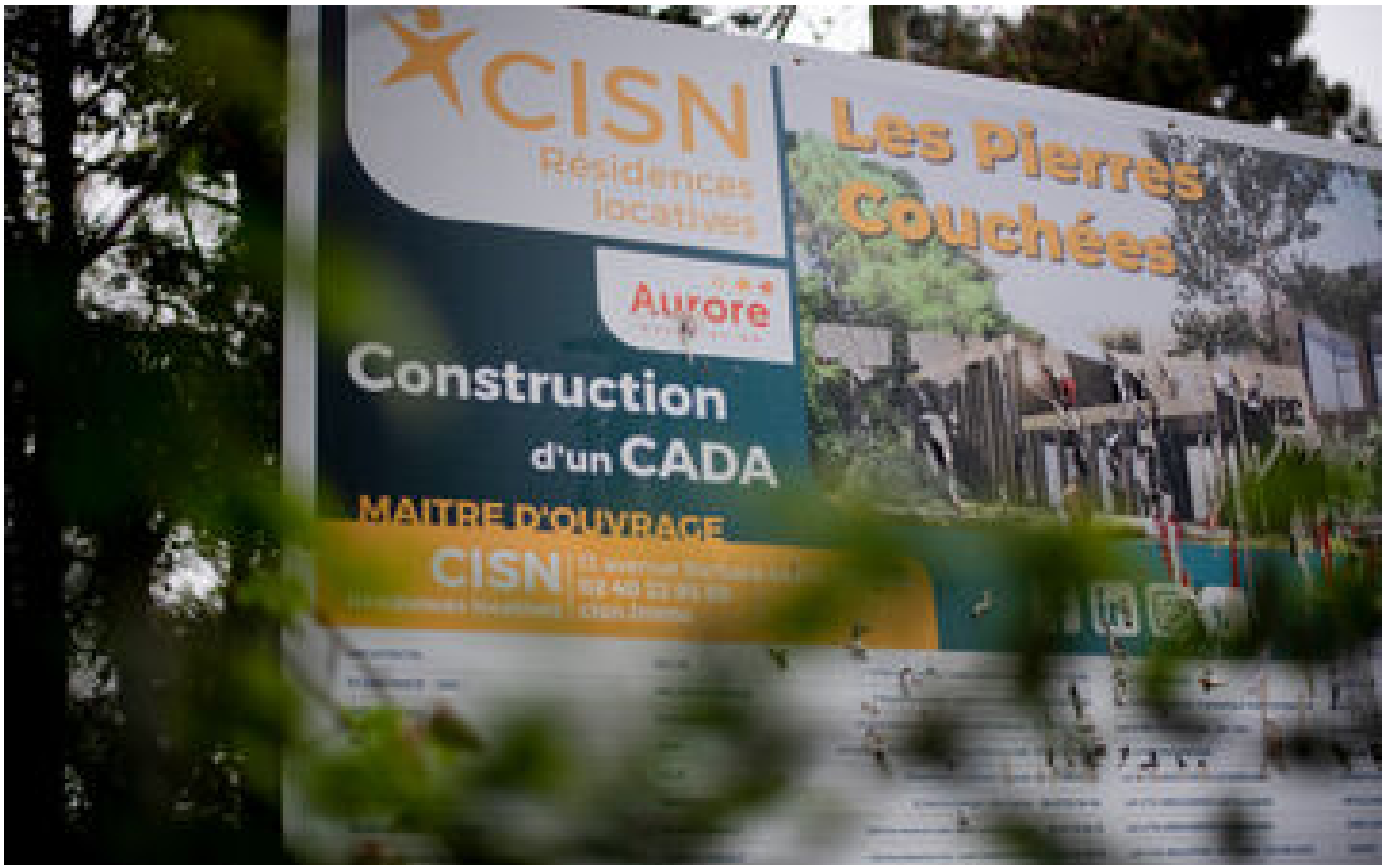
Saint-Brevin : le maire démissionnaire, qui dénonce l'inaction de l'État, sera reçu par Borne