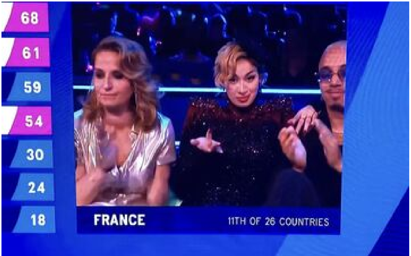
Eurovision : geste controversé et départ anticipé, la triste fin de La Zarra P