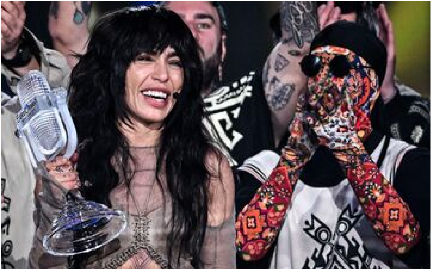
Eurovision : la Suède l'emporte, La Zarra termine sur une 16e place et un comportement déplacé