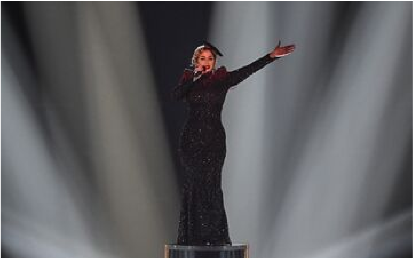
Eurovision 2023 : La Zarra a-t-elle réussi sa prestation ?