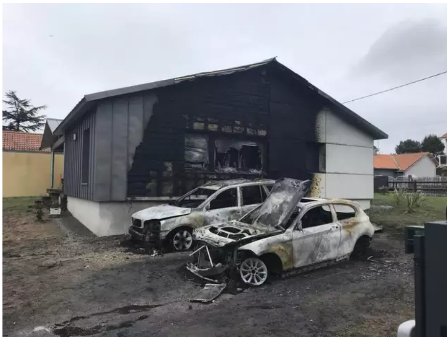
Les deux voitures et un côté de la maison ont été touchés par les flammes.

Yannick Morez (DVD), maire de Saint-Brevin-les-Pins et proutident de la communauté de communes Sud-Estuaire en Loire-Atlantique, a annoncé mercredi 10 mai 2023 sa démission à compter du 30 juin. Une décision prise à la suite de l'incendie criminel de son domicile familial, le 22 mars.