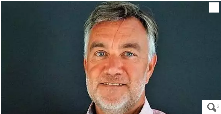
Le maire, Yannick Morez.

« J'ai pris cette décision pour des raisons personnelles, suite au manque de soutien de l'État » : mercredi 10 mai 2023, Yannick Morez maire de Saint-Brevin-les-Pins près de Nantes, a donné sa démission au préfet de Loire-Atlantique.