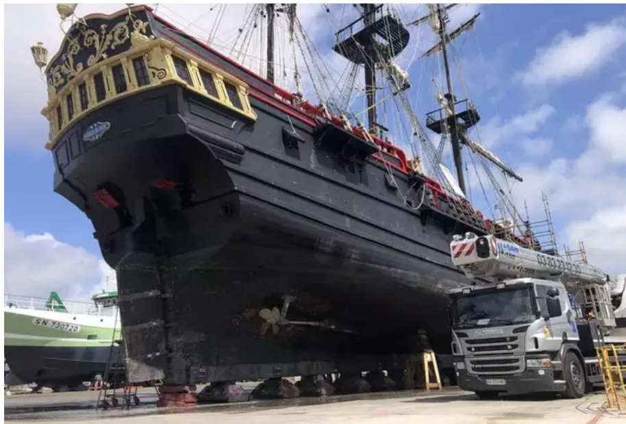
La frégate malouine a été mise au sec avant la Semaine du Golfe pour y parader avec une coque toute propre.

L'équipage du fameux trois-trois-mâts y a commencé son carénage pour pouvoir briller à la Semaine du Golfe du 15 au 21 mai 2023. Il sera remis à l'eau d'ici la parade inaugurale la semaine prochaine.