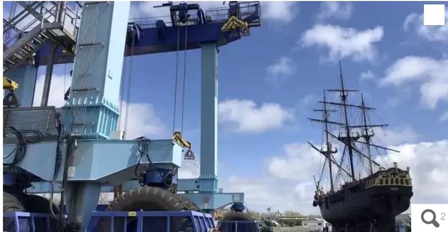
De loin, l'Étoile du Roy ressemble à un jouet qu'on aurait posé sur l'aire de réparation navale. Un gros jouet de plus de 310 tonnes et 47 mètres de long.

La frégate malouine l'Étoile du Roy a été mise au sec sur l'aire de réparation navale de Lorient (Morbihan) pour un carénage avant de parader à la Semaine du Golfe du 15 au 21 mai 2023.