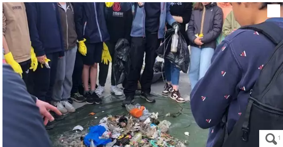
Une partie des déchets ramassés par les collégiens de Jean Paul II, vendredi, sur les plages Plœmeuroises.

Votre e-mail, avec votre consentement, est utilisé par la société Additi Multimedia pour recevoir les newsletters sélectionnées. En savoir plus