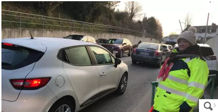
Matin, midi et soir, Sophie est là pour sécuriser le passage des enfants et de leurs parents devant l'école Sainte-Marie à Vannes (Morbihan), dans la rue Chateaubriand.

Copilotes indispensables des conducteurs, les GPS proposent des trajets alternatifs par les quartiers résidentiels de Vannes (Morbihan) afin d'éviter les embouteillages. Au grand dam des riverains excédés par le bruit et l'insécurité.