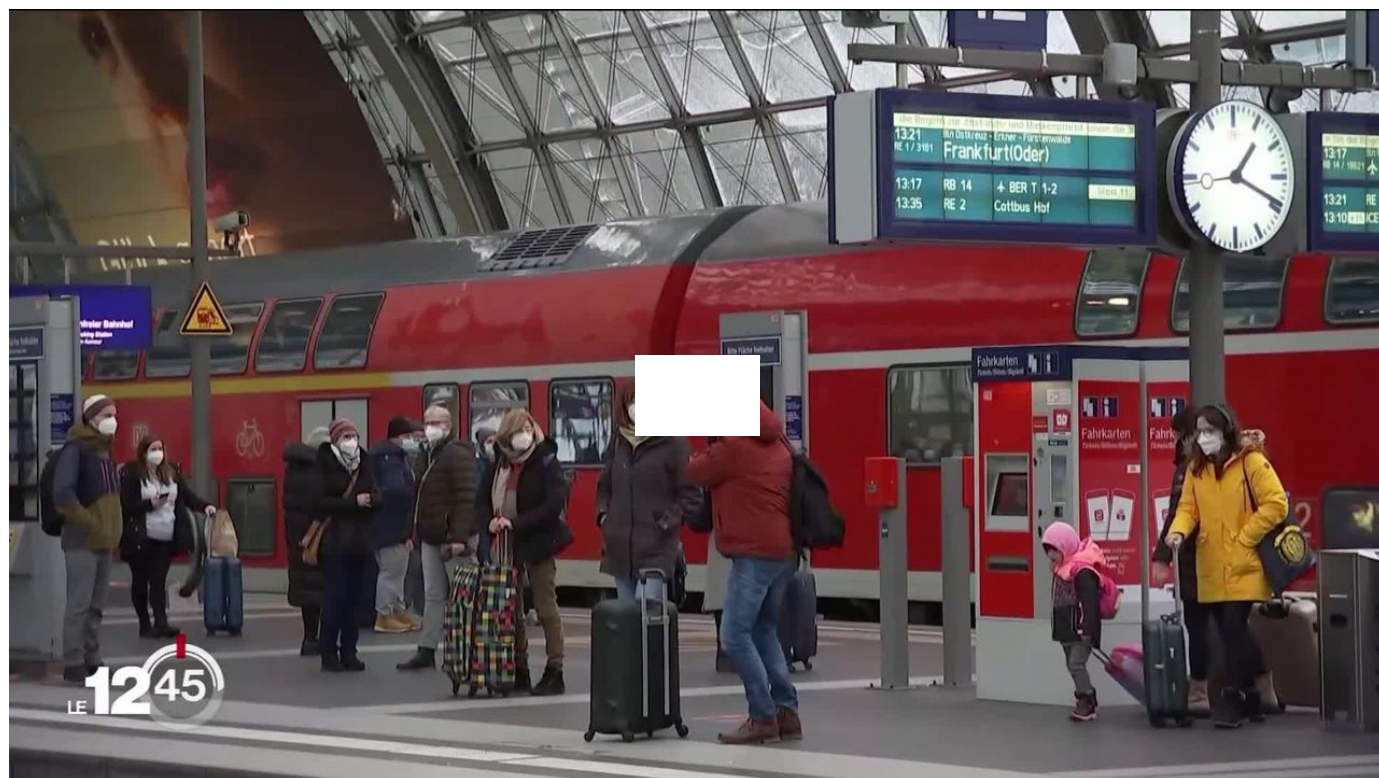
En Allemagne, il est possible depuis lundi de voyager pour 49 euros par mois dans tout le pays sur les lignes de bus, de métro et de trains grâce au "Deutschlandticket". / 12h45 / 1 min. / aujourd'hui à 12:45