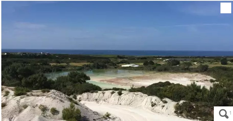
La carrière de Lanvrian.

Le projet d'extension de la carrière de Kaolin porté par la société Imerys a été présenté pour la première fois aux riverains en juin 2016. L'enquête publique qui a été lancée en mars 2023, devait se terminer mardi 2 mai mais est dorénavant prolongée jusqu'au 13 mai 2023.