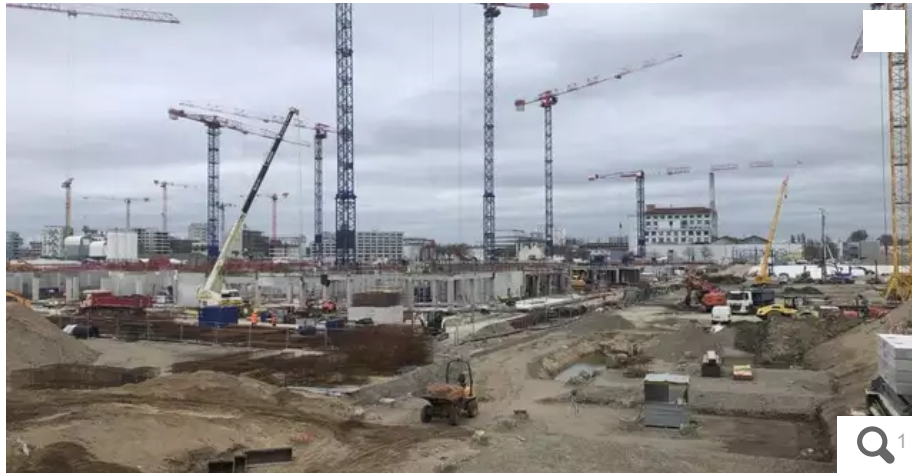
Les travaux du futur CHU, en ce printemps 2023, progressent.

En 2021, 300 000 m³ de terre, d'argile, de sable, mais aussi du béton et des métaux ont été extraits du site sur l'île de Nantes, où doit ouvrir, en 2027, le nouveau CHU de Nantes.