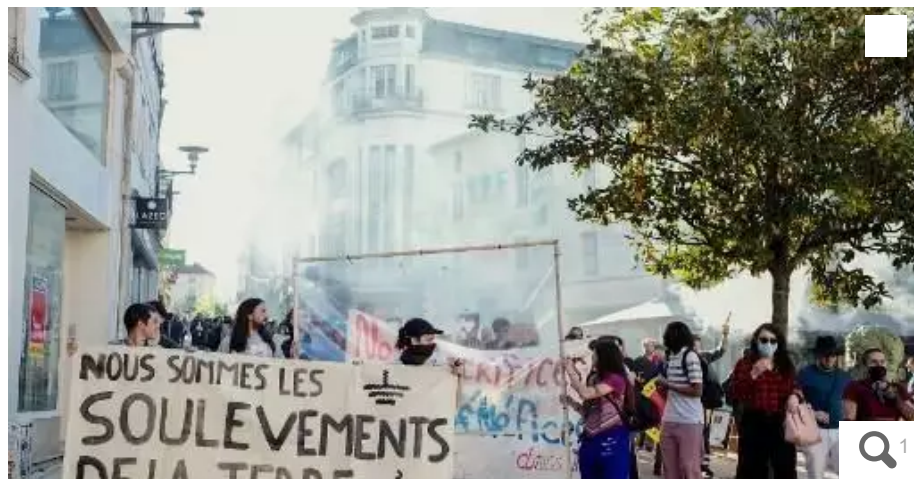
Des manifestants brandissent une pancarte « nous sommes les soulèvements de la Terre », le 19 avril 2023, à Angoulême.