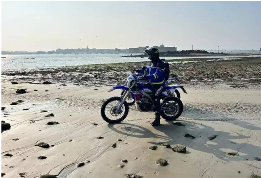
« Un gros 4X4 est engagé, ainsi que plusieurs motos tout-terrain, qui nous permettent d’aller partout, au plus proche des plaisanciers. »