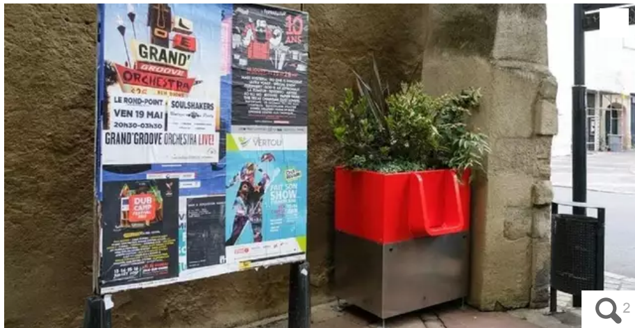
Le confort de ces messieurs a un coût...