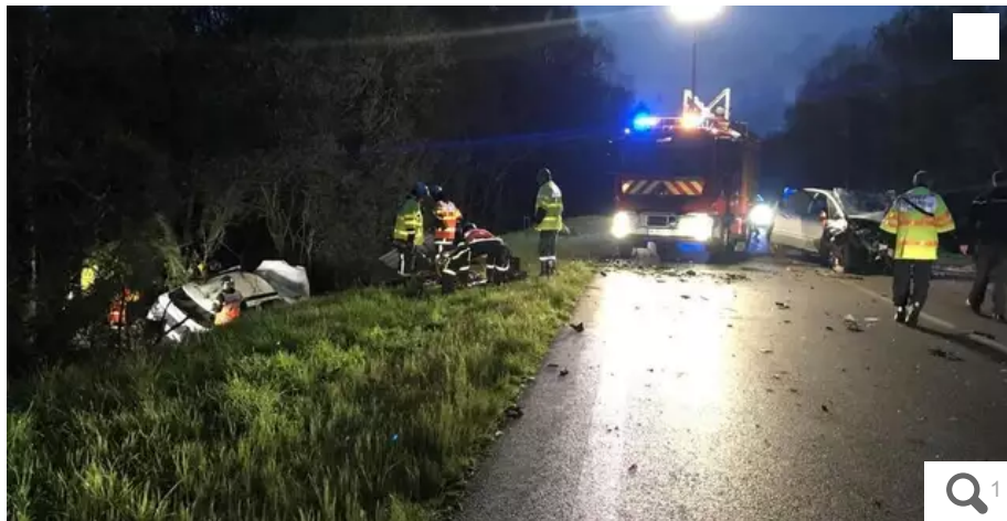
L'accident s'est produit sur l'axe Lorient-Roscoff au niveau de Beg er Roch au Faouët.

Un accident impliquant trois voitures s'est produit, peu après 20 h 30, sur la RD769, au Faouët (Morbihan). Le bilan est très lourd : trois personnes sont décédées, et trois autres blessées, dont deux évacuées en hélicoptère.