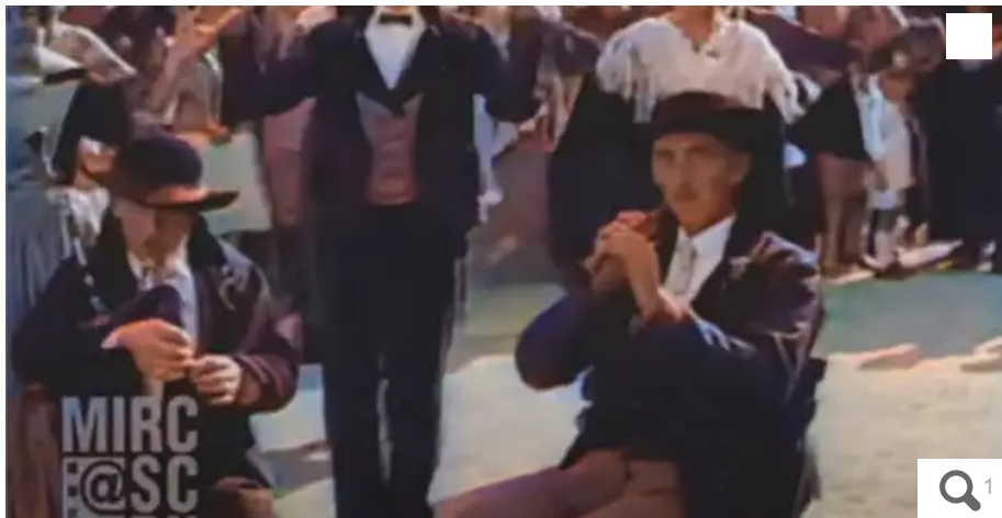
Une captation du film réalisé en 1928 à Locmariaquer, dans le Morbihan, par la compagnie cinématographique Fox Movietone.

Votre e-mail, avec votre consentement, est utilisé par la société Ouest-France Multimédia pour recevoir les newsletters sélectionnées. En savoir plus