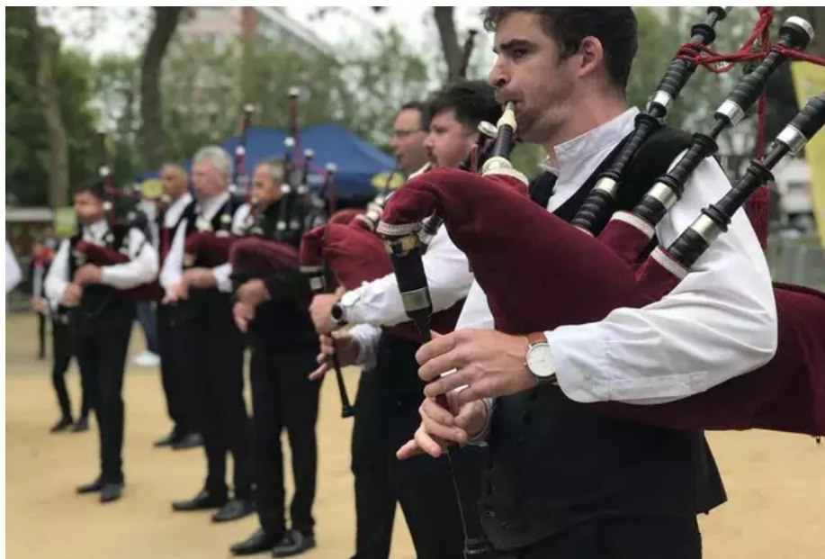
Cinq bagadoù (ici le bagad de Lorient), participent au nouveau printemps des sonneurs, samedi 8 avril 2023.