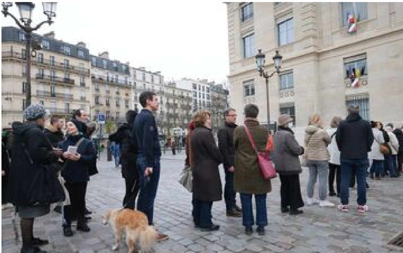
Votation pour ou contre les trottinettes à Paris : des files d'attente en trompe-l'œil devant les mairies d'arrondissement