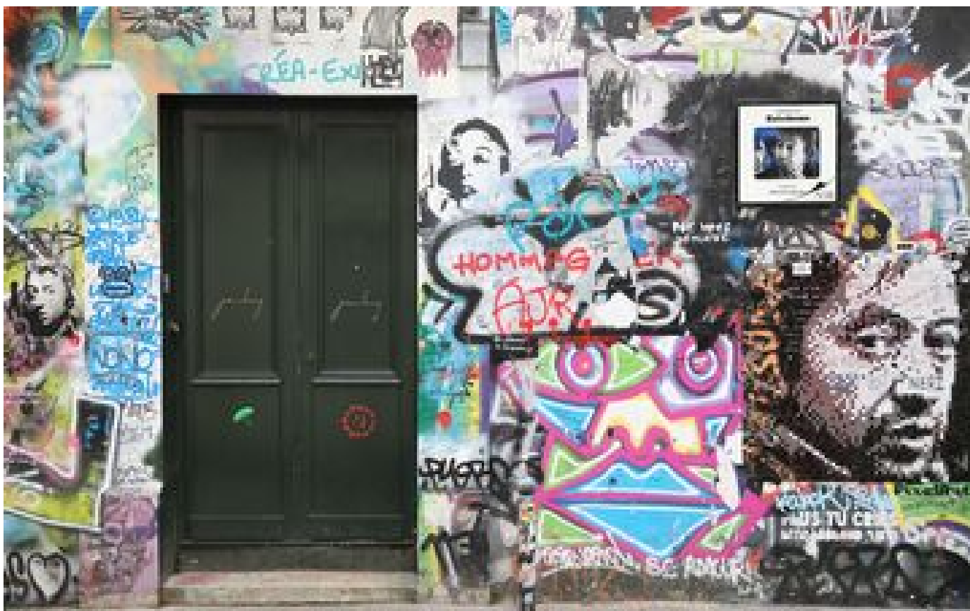
La Maison Gainsbourg accueillera le public en septembre, les réservations ouvertes dès le 4 avril