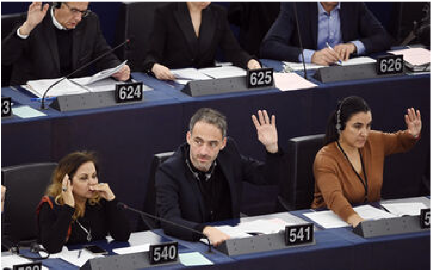
Intelligence artificielle : parmi les politiques, Midjourney inquiète et fait débat P