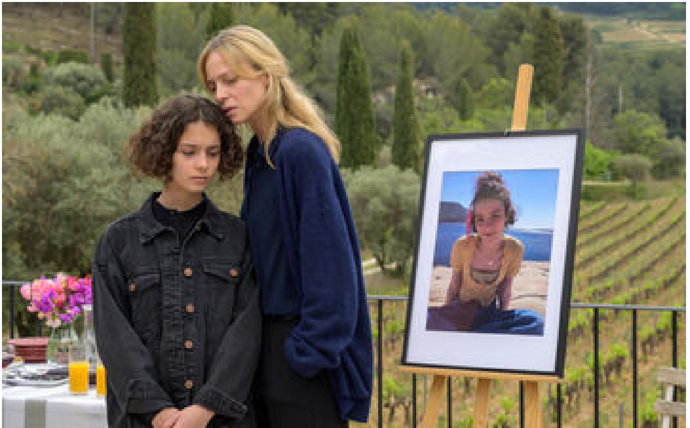
Programme TV du mercredi 29 mars : « Et doucement rallumer les étoiles », « John Wick »... Notre sélection P