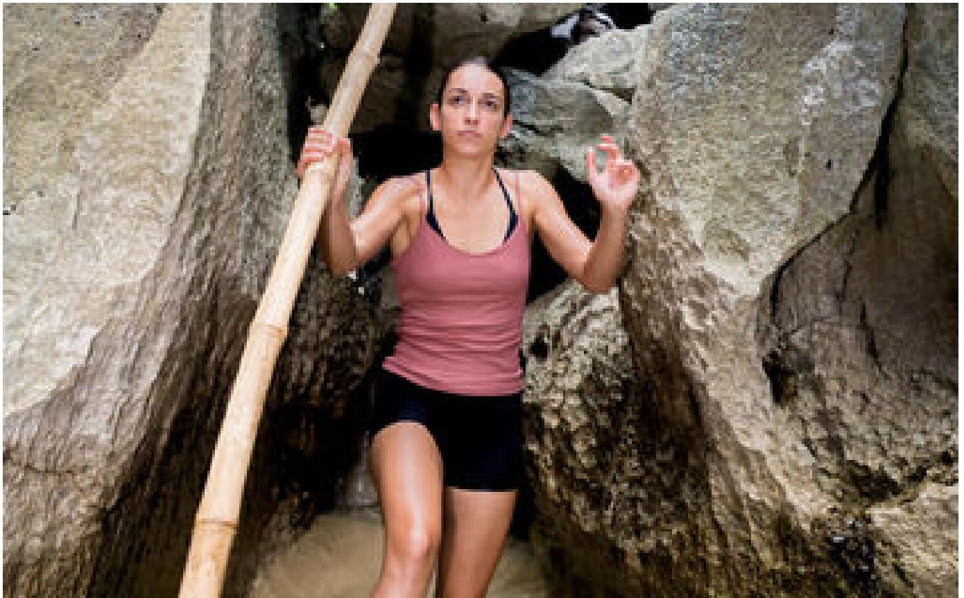
« Koh-Lanta, le feu sacré » : entorse de cheville et maux de ventre