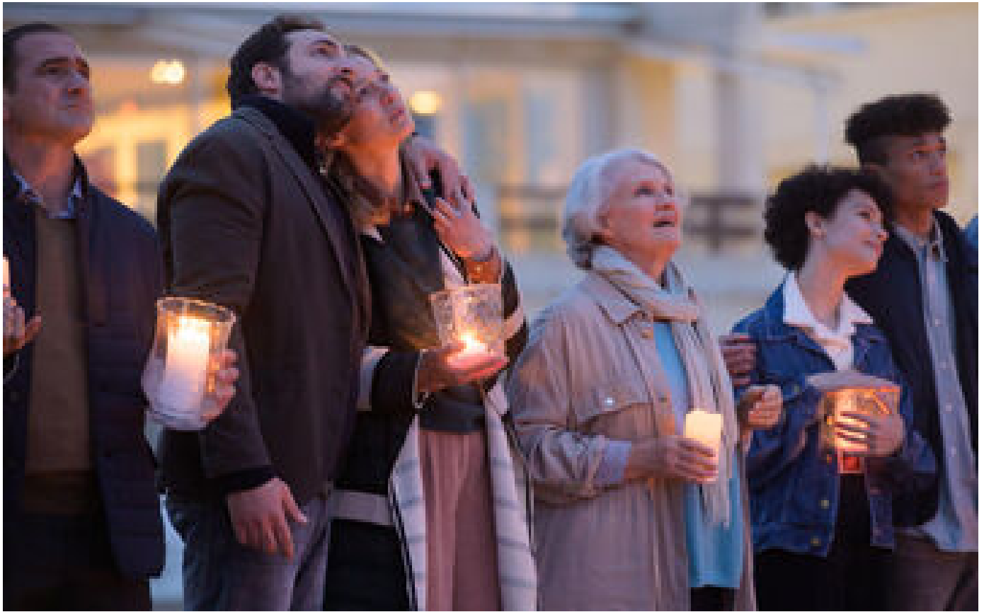
« Et doucement rallumer les étoiles » sur France 2 : un téléfilm pour alerter sur le suicide des jeunes