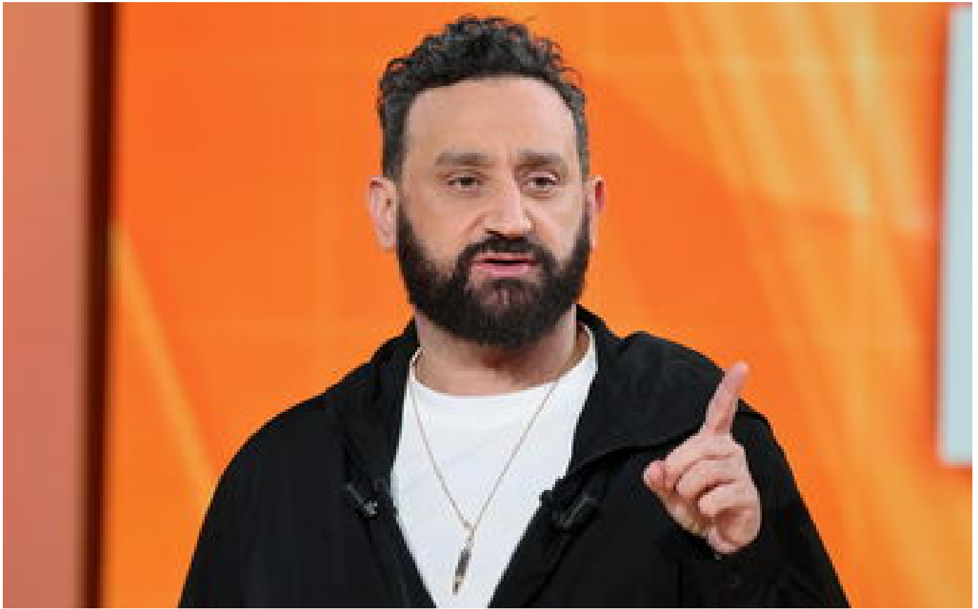
Pour le patron de l'info de TF1, Cyril Hanouna « fait beaucoup de mal »