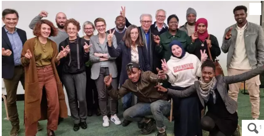
La promotion a bénéficié de parrainages assurés par des volontaires en entreprise qui partagent leur culture française et leur expérience du monde du travail.

Le dispositif Baraka, porté par le réseau d'entreprises partenaires de l'association Face Loire-Atlantique, accompagne des réfugiés vers l'emploi. Sa 4e promotion fait un carton.