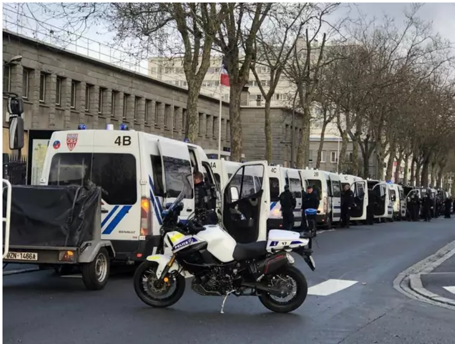
Une compagnie de CRS a été dépêchée pour protéger le commissariat de Lorient.