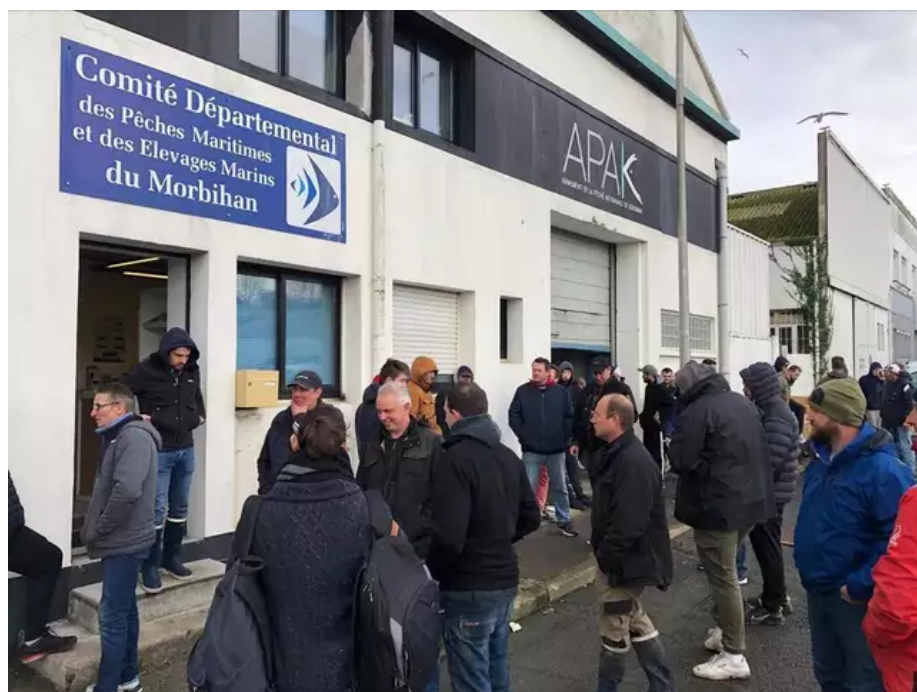
Des pêcheurs occupent le comité des pêches de Lorient.