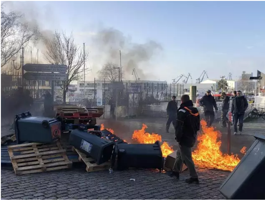
Les pêcheurs de Lorient ont mis le feu à un amas de poubelles et de palettes.