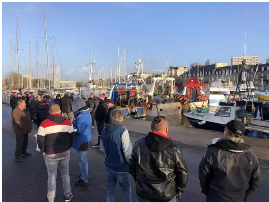
Une soixantaine de pêcheurs ont amarré leurs bateaux à l'entrée du port de plaisance, à Lorient, ce vendredi 24 mars 2023.

LIRE AUSSI : Les pêcheurs voulaient se rendre au Parlement, la manifestation tourne à l'affrontement à Rennes