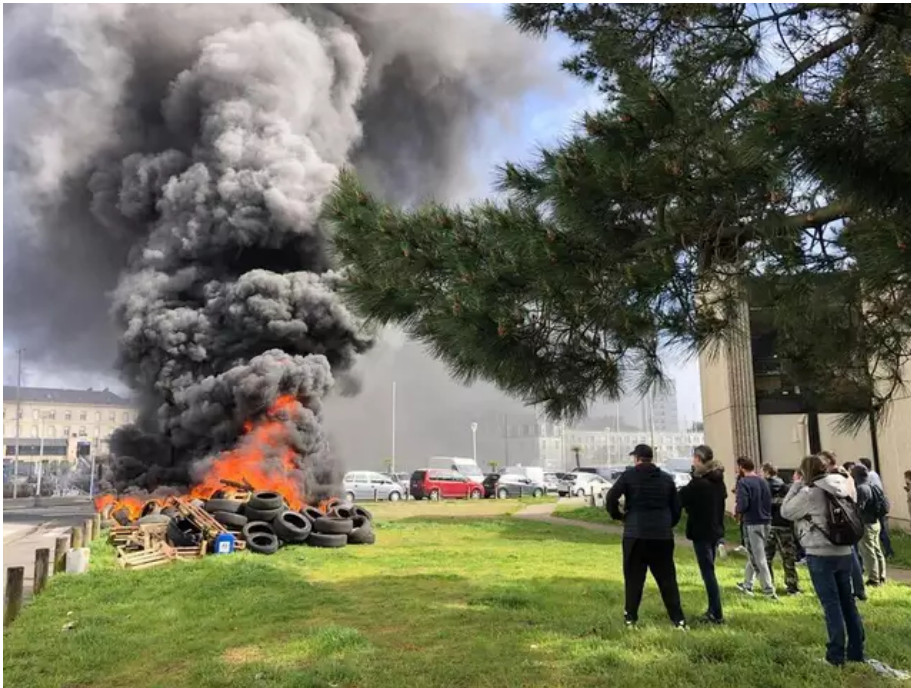
Après un regain de tension entre pêcheurs et forces de l'ordre, quai de Rohan, la circulation a fini par être rétablie.

11 h 30. Alors que les actions des pêcheurs semblaient se terminer, un regain de tension est observé quai de Rohan, où la circulation est coupée par les forces de l'ordre. Aux environs de midi, les choses s'apaisent, la circulation est finalement rétablie.