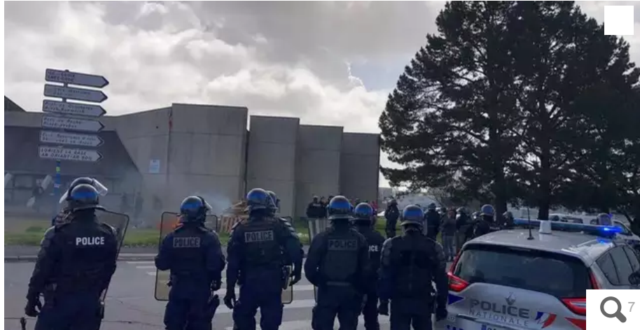
La circulation a été coupée quai de Rohan, à Lorient (Morbihan), en fin de matinée.

Deux jours après les manifestations qui avaient rassemblé près de 700 d'entre eux à Rennes, les pêcheurs poursuivent leurs actions. Ce vendredi 24 mars 2023, une soixantaine d'entre eux ont amarré leurs bateaux à l'entrée du port de plaisance et bloquent les liaisons en bateau bus à Lorient (Morbihan). Des fusées de détresse ont été tirées en direction de la gendarmerie maritime, les locaux de Pêcheurs de Bretagne ont été saccagés.