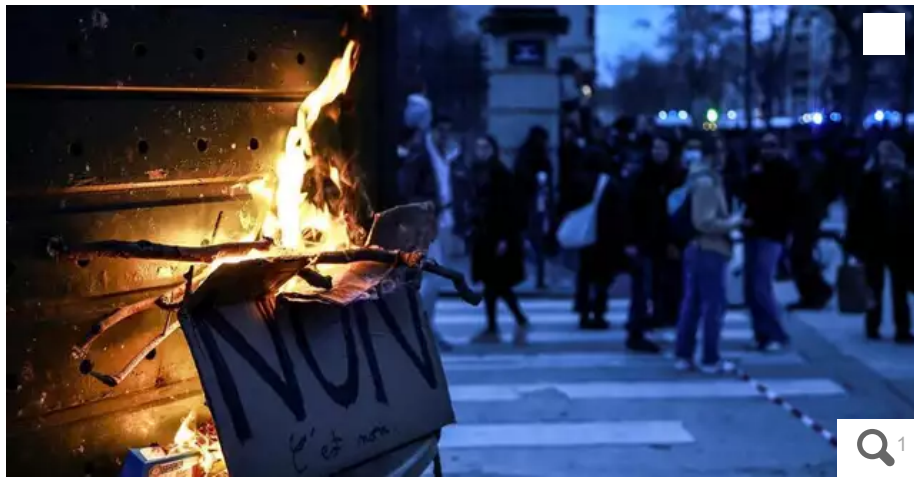
Une pancarte portant l'inscription « Non » brûle lors d'une manifestation contre la réforme des retraites du gouvernement sur la place Vauban à Paris, France, le 20 mars 2023.

Des milliers de personnes se sont rassemblées dans la soirée du lundi 20 mars 2023 pour protester contre la réforme des retraites après le rejet de la motion de censure transpartisane à l'Assemblée nationale. Des dégradations et affrontements avec les forces de l'ordre ont été observées dans de nombreuses villes de France.