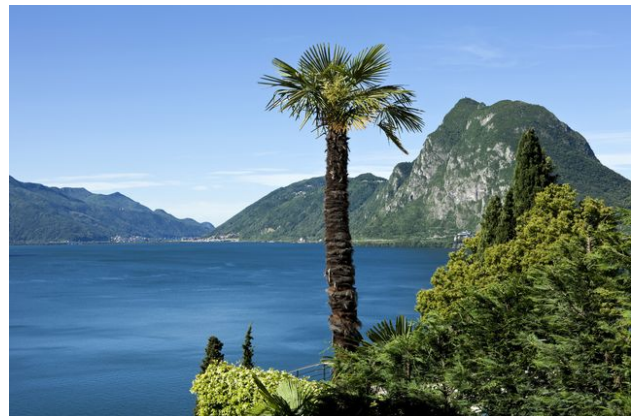
Le palmier chanvre, devenu un symbole du Tessin.

En plus des études sur le terrain et en laboratoire, les scientifiques ont réalisé sondage dans toute la Suisse sur la perception du palmier chanvre par la