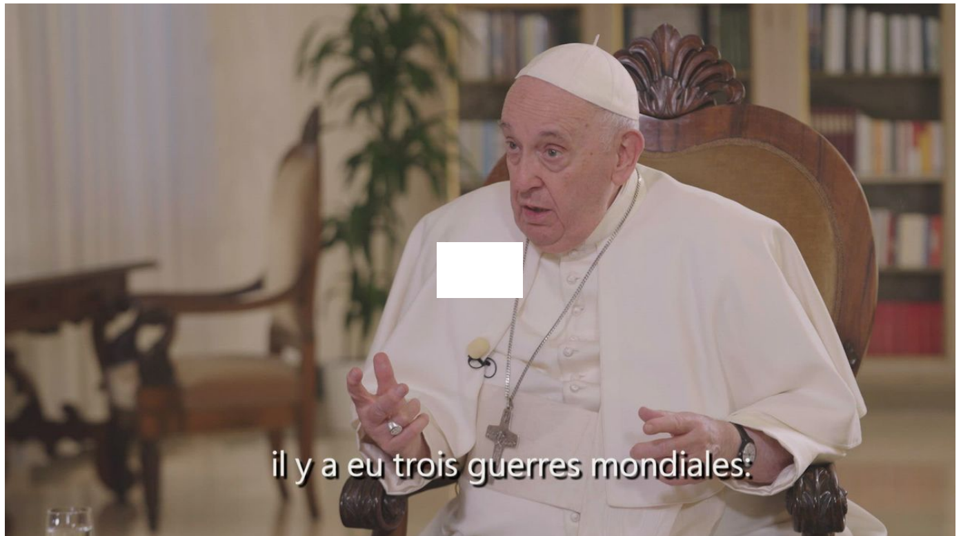
"En cent ans, il y a eu trois guerres mondiales", estime le pape François / L'actu en vidéo / 2 min. / hier à 21:40