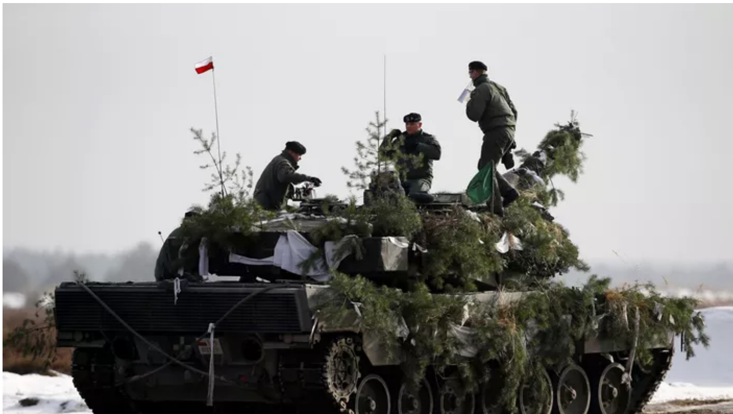
Un char leopard 2.

À l'instar de l'Allemagne, la République tchèque a demandé à la Suisse de vieux chars Leopard 2, qui sont actuellement en stockage dans le pays alpin, a révélé lundi la ministère suisse de la Défense, Viola Amherd. « Nous avons une demande de l'Allemagne et depuis lors nous avons aussi une demande de la République tchèque », a déclaré Viola Amherd à la télévision publique SRF. « Nous n'avons pas discuté de l'achat de chars à la Suisse, mais si la Suisse voulait nous donner ses Leopard 2 comme récompense pour notre aide à l'Ukraine nous ne serions certainement pas contre », a précisé le porte-parole du ministère tchèque de la Défense, David Jares, interrogé par l'AFP.