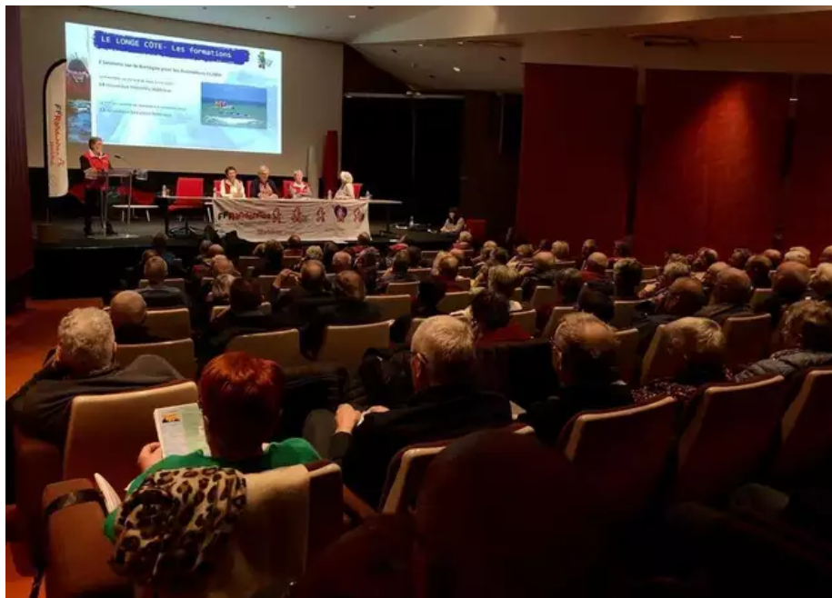
La Fédération française de randonnée du Morbihan s'est réunie en assemblée générale, ce samedi 4 mars 2023, à Vannes (Morbihan).

affiliées à la fédération et nous aimerions que d'autres nous rejoignent.