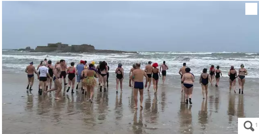
Bain du Nouvel an de 2022 au Fort Bloqué organisé par Form'océan.

Deux occasions de baignade iodée et tonifiante sur Plœmeur (Morbihan). La Sonalom et Form'Océan organisent, chacun un bain de la nouvelle année, samedi 7 janvier 2023.